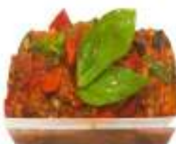
CAPONATA SECCHIELLO KG 3 COTTA