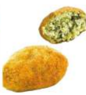
ARANCINI SPINACI 220G 30 PZ CRUDI