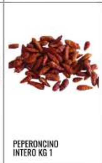
PEPERONCINO INTERO KG 1