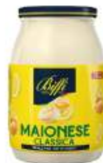
MAIONESE "VASO" VETRO KG. 1