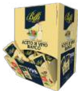
ACETO BIANCO BUSTINE 5 ML