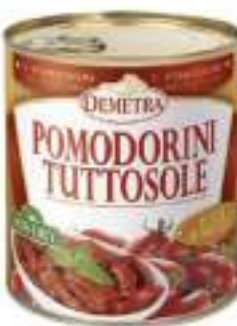
POMODORINI TUTTO SOLE 4/4