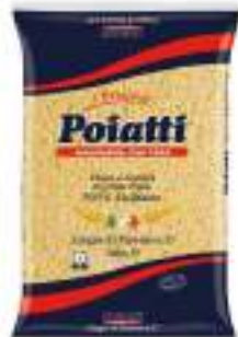
POIATTI LINGUE DI PASSERO 17 KG 1