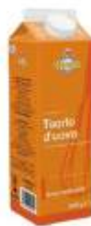
TUORLO UOVO BRIK L 1