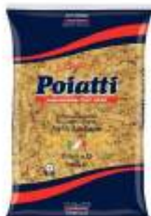
POIATTI DITALI 31 KG 1