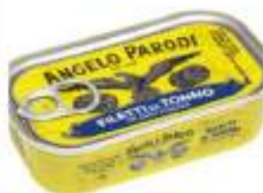
TONNO FILETTI 125 G