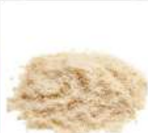
FARINA MANDORLE PELATE KG 1