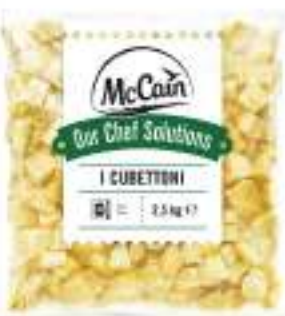
PATATE CUBI MCCAIN CONG.