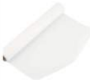
CARTA FORNO 40X60 kg5