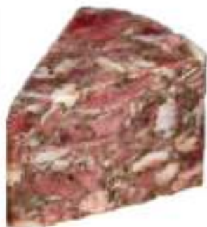
SOPRASSATA SUINO 1/4 SCARPACCIA