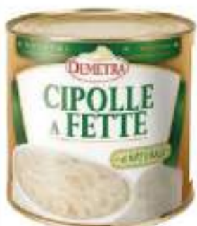
CIPOLLE FETTE NAT 3/1 DEMETRA