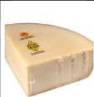
FORMAGGIO NOSTRALE 1/8 12/14M