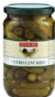
CETRIOLINI MEDI ACETO V3100