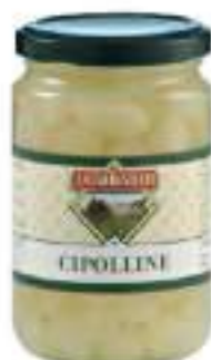
CIPOLLINE PERLINE ACETO V.3100