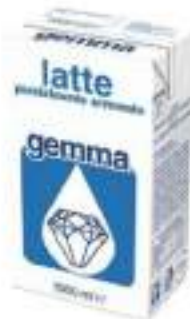
LATTE UHT PS.1LX12 BRIK CT