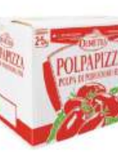
POLPA FINE BOX DEMETRA 2X5