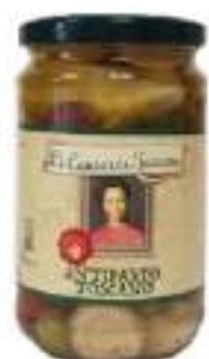
ANTIPASTO TOSCANO VASO 3100