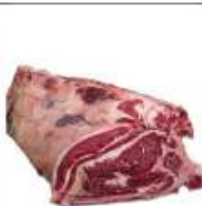
ROASTBEEF BOV.AD. C/O 3C PL