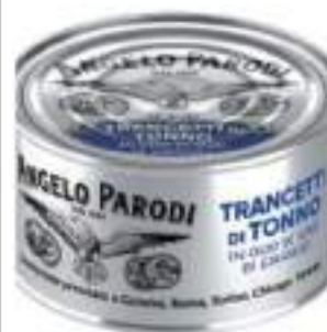
TONNO TRANCETTI YF KG 1