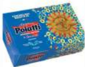
POIATTI CONCHIGLIONI 93 G.500