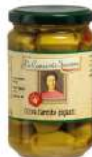
OLIVE FARCITE VASO 3100 ML