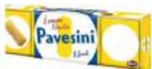
PAVESINI BISCOTTI G. 200