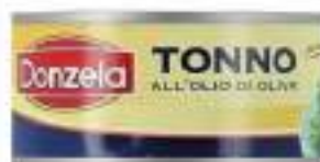
TONNO OLIO OLIVA CONF.G.160 N