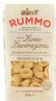
ORECCHIETTE 87 RUMMO 500G