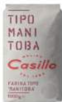
FARINA T.O MANITOBA CASILLO