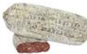
SPIANATA CON CINGHIALE KG 2 CA