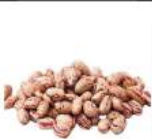
FAGIOLI BORLOTTI SECCHI KG 5