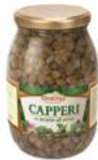
CAPPERI IN ACETO VASO KG 1