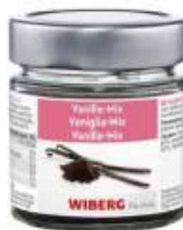
VANIGLIA MIX IN POLVERE