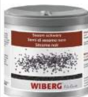
SEMI SESAMO NERO WIBERG