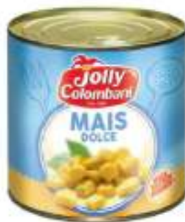
MAIS LATTINA A STRAPPO GR.326