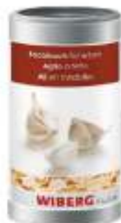
AGLIO A FETTE WIBERG