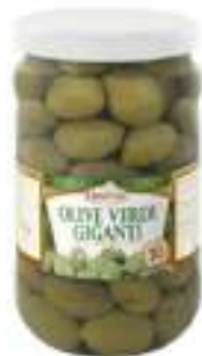
OLIVE VERDI GIG. AROM 1700 VAS