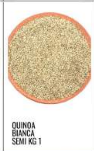
QUINOA BIANCA SEMI KG 1