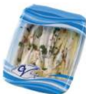
ALICI MARINATE OLIO KG 1