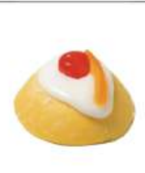
CASSATELLE MIGNON ARANCIO 12PZ