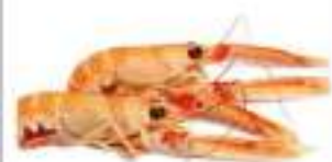
SCAMPI 8/12 CONG.