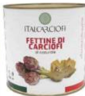
FETTINE CARCIOFO NAT. 3/1