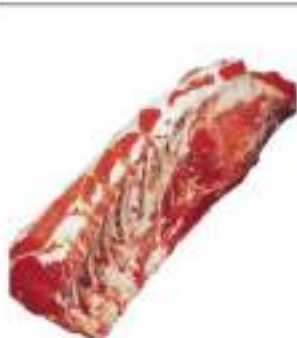
ROASTBEEF SCOTT. ES C/O MED.