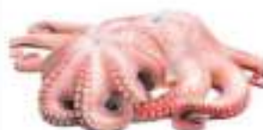
POLPO MAROCCO T5 PP