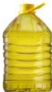
OLIO SEMI GIRASOLE PET L 5