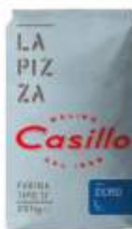
FARINA PER PIZZA O L KG25