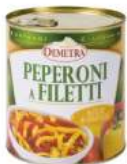
PEPERONI FIL.OLIO GIRAS.L.4/4