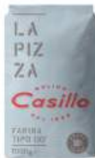
FARINA DI GRANO TENERO 00 KG 1