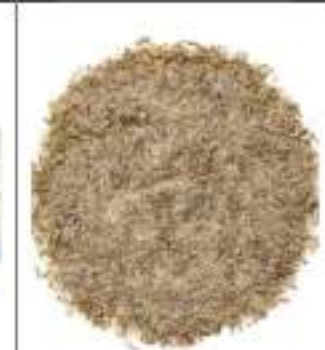
AROMI PER ARROSTO S/SALE C.kg1