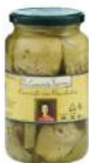
CARCIOFI CON GAMBO 3100 ML