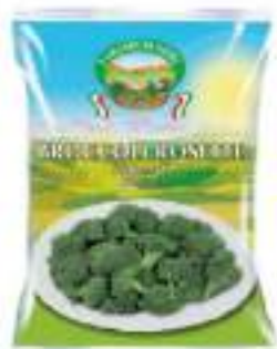
BROCCOLI IQF CONGELATI