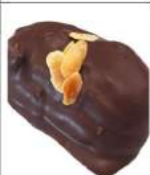
RAME DI NAPOLI TRADIZIONALI KG 3