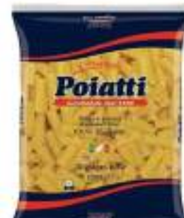
POIATTI RIGATONI 54 KG 1