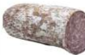
BRICIOLONA TOSCANA 1/2