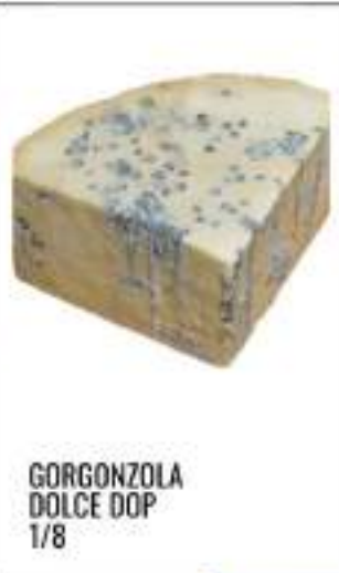
GORGONZOLA DOLCE DOP 1/8