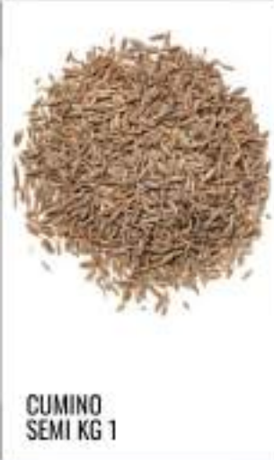
CUMINO SEMI KG 1