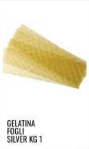
GELATINA FOGLI SILVER KG 1