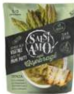
CREMOSITA' ASPARAGI CHEF 800BS