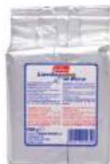
LIEVITO SECCO KG 1