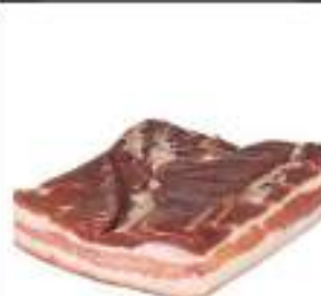
PANCETTA AFFUM.BACON S/V 1.5