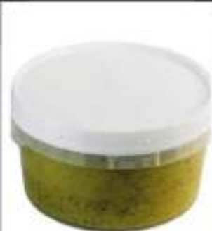
PESTO EXTRA KG.1,5