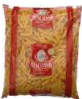
ELICOIDALI RISCOSSA KG 3