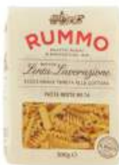
PASTA MISTA 74 RUMMO G 500