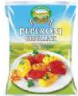
PEPERONI GRIGLIATI 5X1 KG