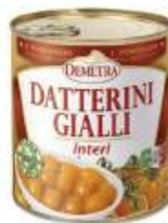
DATTERINI GIALLI AL NAT.