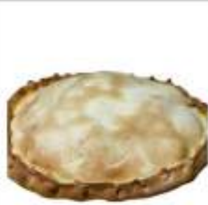
SCACCIATA BROCCOLI E SALSICCIA 1,5KG