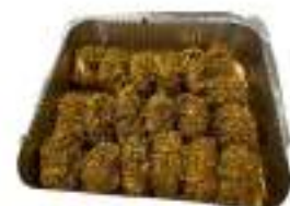
INVOLTINI CARNE PISTAC. FORMAG 1,25