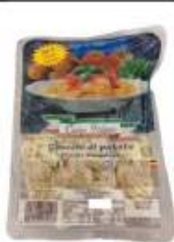
GNOCCHI DI PATATE 500