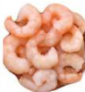
GAMBERI SGUSC. CONG. 30/50