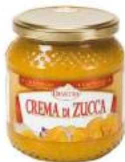
CREMA ZUCCA VASO 500G