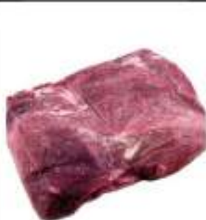
POLPA CINGHIALE CONG.