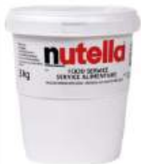
NUTELLA SECCHIELLO KG 3