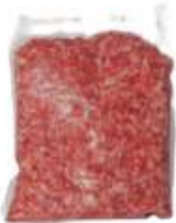
PASTA DI SALSICCIA ROSI