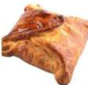
CIPOLLINE 210G 35PZ CRUDE