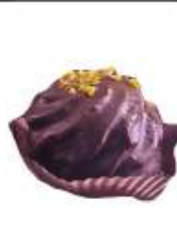
MONOPORZIONI TORTINO GIANMARIA 135G 12PZ