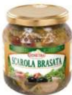
SCAROLA BRASATA VASO 500