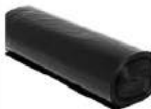
SACCHI NERI 70X110