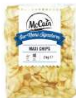
PATATE MAXI CHIPS MCCAIN CONG.