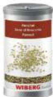
AGLIO POLVERE WIBERG