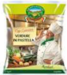
VERDURE MISTE PASTELLATE 5X1 K