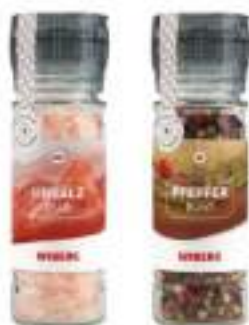
SET CON MACININO SALE E PEPE