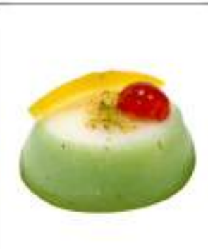
CASSATELLE MIGNON PISTACCHIO 12 PZ 120G