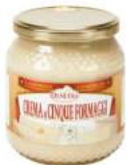
CREMA 5 FORMAGGI VASO 580