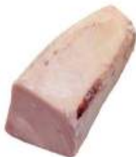
PESCE SPADA TR/SPAGNA CONG