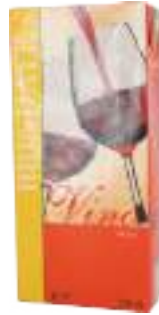
VINO ROSSO BRIK L 1