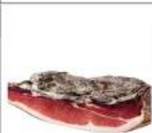
SPECK A 1/2 S/V STAGIONATO