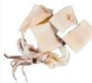
CALAMARI PAT. AN. CIUFFI CON. 900