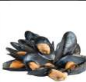
COZZA C/GUSCIO CONGELATE