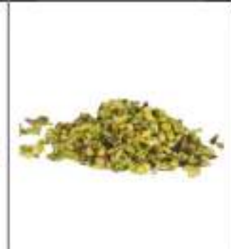
PISTACCHI GRANELLA KG 1