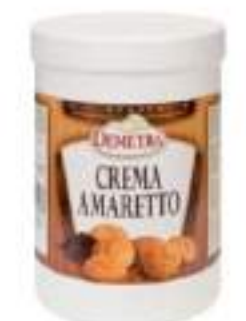
CREMA AMARETTO KG 1