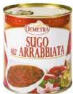
SUGO ALLA ARRABBIATA LATT.4/4