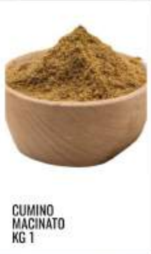
CUMINO MACINATO KG 1