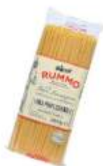
SPAGHETTI 3 RUMMO KG 1