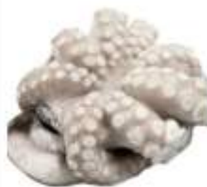
MOSCARDINI IQF BUSTA CONG.