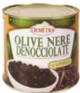
OLIVE NERE DENOCC.SALAM.La 3/1