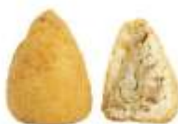
ARANCINI VEGAN/CARCIOFI 220G 30 PZ CRUDI