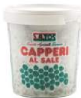
CAPPERI S/SALE CON.K1 cal.9/11