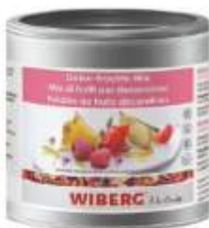
PANPEPATO MIX DI SPEZIE