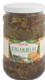
FRIARELLI O.GIRASOLE VASO 1700