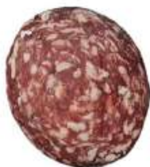
SBRICIOLONA SCARPACCIA KG 3,5