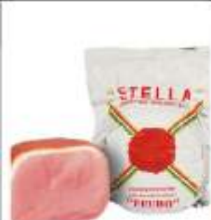
PROSC. COTTO FEUDO 1/2 SV