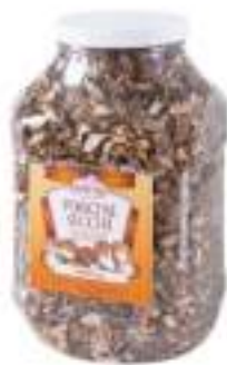
FUNGI PORCINI SECCHI PET 500g