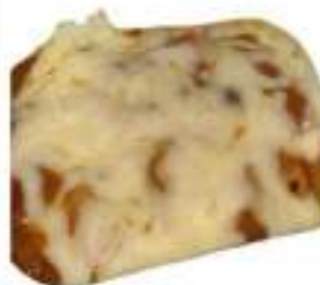
PASTA AL FORNO G.300 MONO