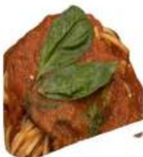
INVOLTINI SPAGHETTI 300G MONO