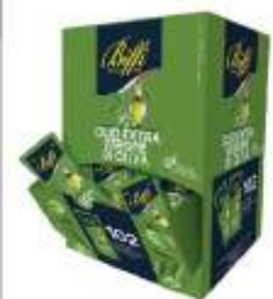
OLIO EXTRAVERGINE BST 10ML