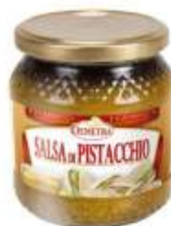
SALSA DI PISTACCHIO VASO 500