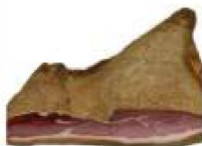
PEPATELLO SGAMBATO S/O 1/2 SV