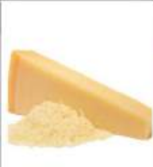
GRANA PADANO GRATTATO G. 100