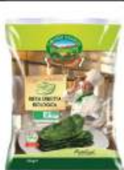
BIETA BUSTE 4X2,5