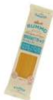
SPAGHETTI 3 GLUTEN FREE RUMMO