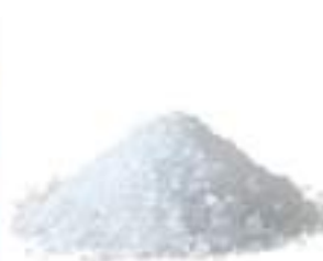
SALE GROSSO MARINO