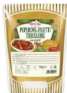
PEPERONI TRIC. ARR.700 BST