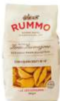
CONCHIGLIONI RIGATI 147 G.500