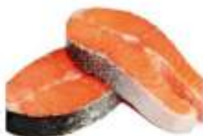
SALMONE TRANCE CONG.