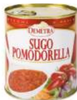
SUGO POMODORELLA 4/4