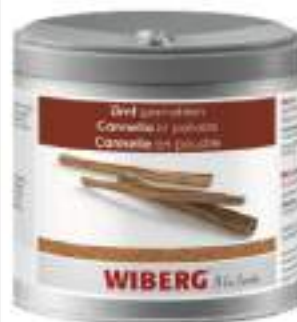
CANNELLA IN POLVERE