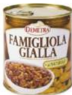
FUNGHI FAMIGL.GIALLA LATTA 4/4