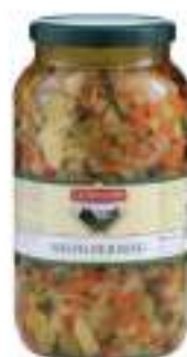
MISTO RISO 3100 ML