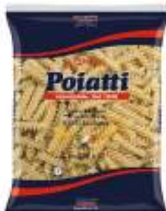
POIATTI FUSILLI 52 KG 1