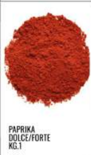
PAPRIKA DOLCE/FORTE KG.1