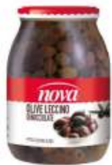
OLIVE DEN LECCINO 1062ml NOVA