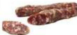
SALSICCIA DI CINGHIALE KG. 1