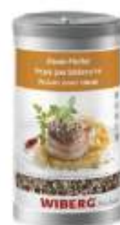
PEPE PER BISTECHE