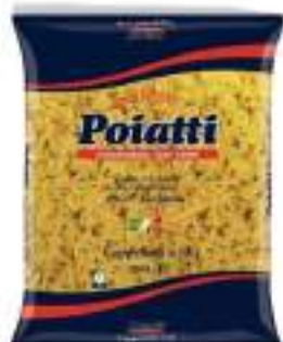
POIATTI CAPPELLETTI 58 KG 1