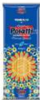
POIATTI TRINE 14 G.500