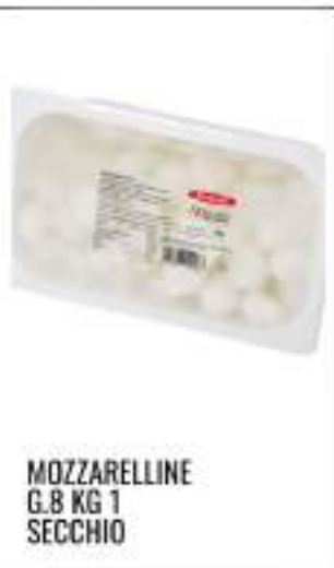
MOZZARELLINE G.8 KG 1 SECCHIO