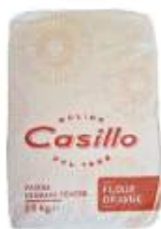
FARINA 00 FLOUR ARANCIO KG 25