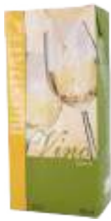
VINO BIANCO BRIK L 1