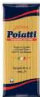
POIATTI SPAGHETTI 3 KG 1