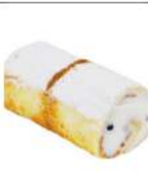
ROLLE RICOTTA 12 PZ 120G