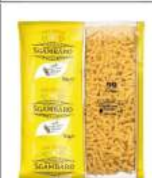
FUSILLI SGAMBARO KG 5