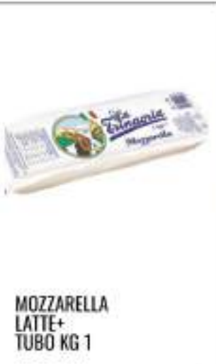
MOZZARELLA LATTE+ TUBO KG 1