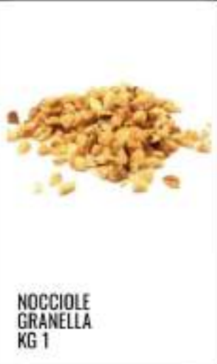
NOCCIOLE GRANELLA KG 1