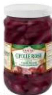
CIPOLLE ROSSE ACETO TROPESA VASO 1700