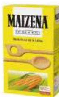
MAIZENA AMIDO DI MAIS