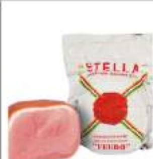
PROSCIUTTO COTTO FEUDO