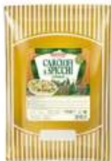
CARCIOFI TRIF.SPICCHI BST 1.7