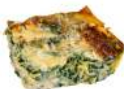
LASAGNE RICOTTA SPINACI KG 2,4 VASCH.