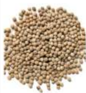
PEPE BIANCO MAC. KG.1