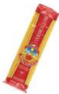
VERMICELLONI RISCOSSA G.500