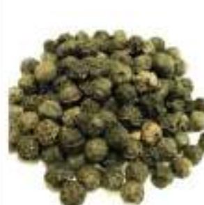
PEPE VERDE NAT. SECCH.G500