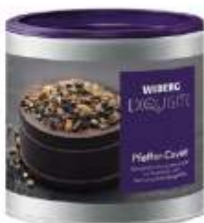
PEPE CUVEE MIX SPEZIE