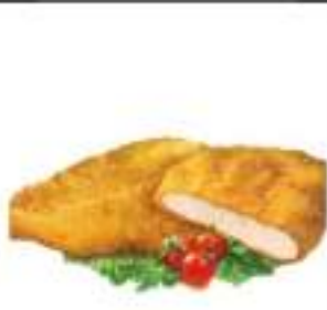
COTOLETTE DI POLLO CONG.