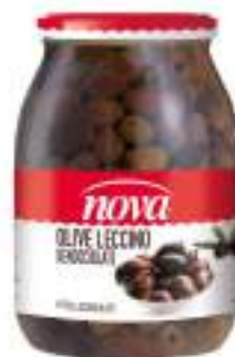
OLIVE LECCINO DEN. 1062 ML LOMB.