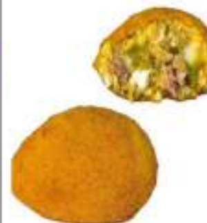
ARANCINI BROCCOLI/SALA 220G 30 PZ CRUDI