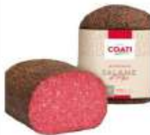
SALAME AL PEPE