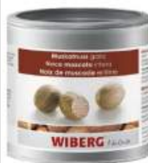
NOCE MOSCATA INTERA WIBERG