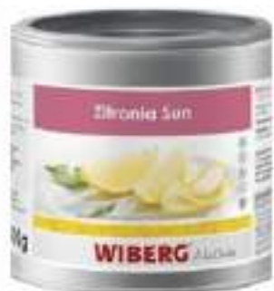
ZITRONIA SUN OLIO LIMONE NAT.