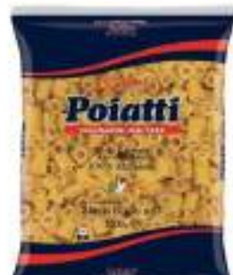
POIATTI MEZZANI RIGATI 53 KG 1