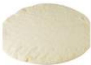
DISCO PIZZA S/GLUTINE 280G