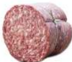
SBRICIOLONA GIGANTE 1/2 SV