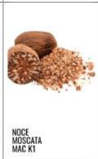
NOCE MOSCATA MAC K1