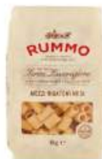
MEZZI RIGATONI RUMMO KG 1