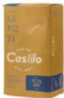
FARINA PER PIZZA O UNICA KG 25