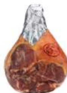
PROSC.CRUDO MEC DIS.MIC.