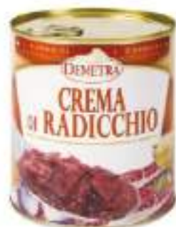
CREMA DI RADICCHIO La 4/4