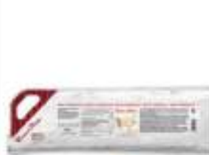
CREMA A POCHE GORGONZOLA