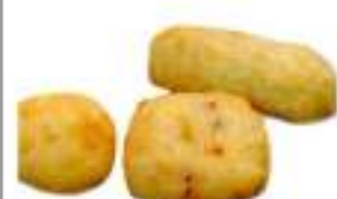
TRIS MINI CROCCHIE PATATE KG. 5 COTTI