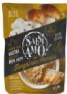
CREMOSITA'FUNGHI CHEF 800g