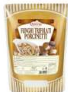
FUNGHI TRIF.PORCINETTI BST 700