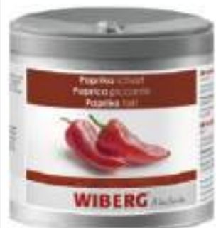
PEPERONCINO ROSSO INTERO WIB