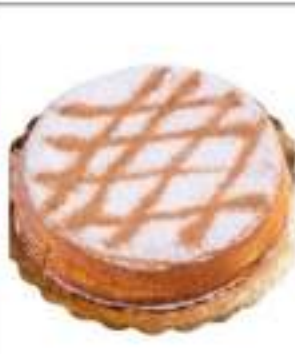
TORTA CASSATA AL FORNO 1,1 KG