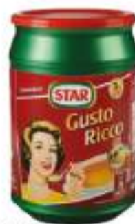
PREP. X BRODO GRAN GUSTO RICCO