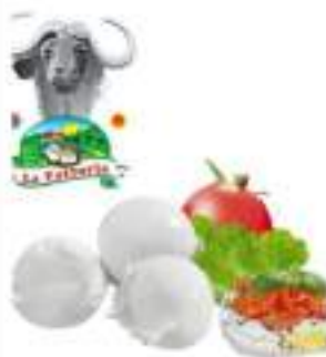
MOZZARELLA BUFALA 250 FATTORIA