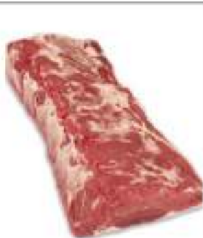
ROASTBEEF S/O BOV.AD. SV ES