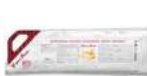
CREMA A POCHE 4 FORMAGGI