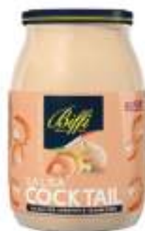
SALSA COCKTAIL BIFFI VASO 960G