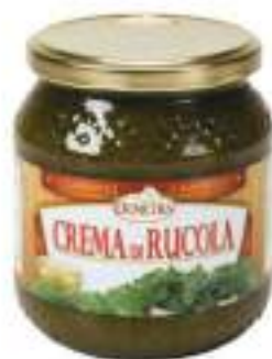
CREMA DI RUCOLA VASO 500G