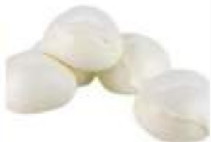
MOZZARELLA BUFALA 50G FATTORIA