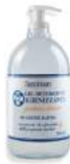
GEL IGIENIZZANTE SANIMAN 500