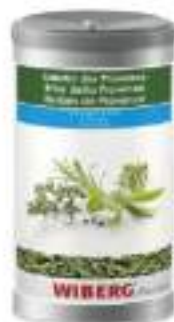
ORIGANO ESSICCATO BRT 1200