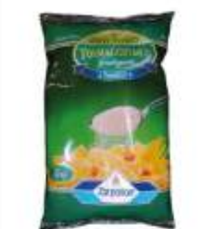
FORMAGGIO GRATTATO MIX KG 1