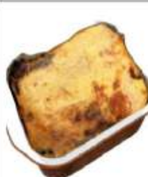
MELANZANE ALLA PARMIGIANA CONG. KG 2