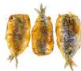
ALICI BECCAFICO 1,25 KG