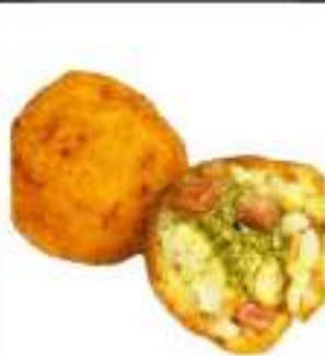
ARANCINETTI PISTACCHIO MIGNON KG 6 CT