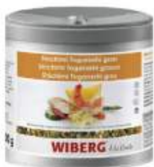
SHISHIMI TOGARASHI WIBERG