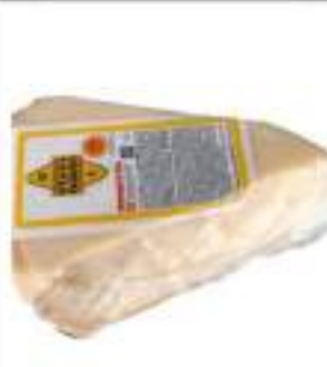
FORMAGGIO GRANA DA GRATTUGIA