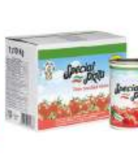
POLPA FINE BAGINBOX 10 KG