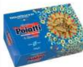
POIATTI TAGLIATELLE 87 G.500