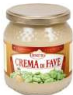
CREMA DI FAVE VASO 580VV