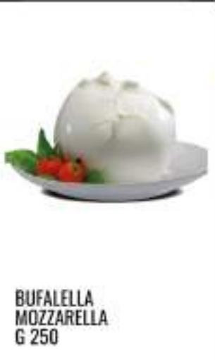
BUFALELLA MOZZARELLA G 250