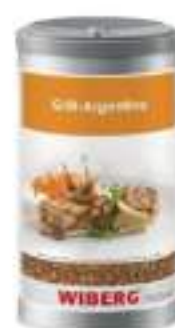
GRILL ARGENTINA SENZA SALE WIB