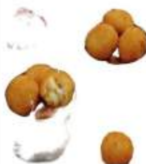
MAC CACIO E PEPE G.20 KG 5 COTTE