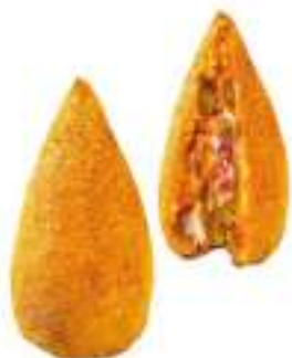
ARANCINI RAGU' 200G 30 PZ CRUDI