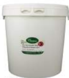
BOMBA OLIVE VERDI C/NOCCILO SCHIACC. K4