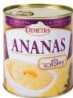
ANANAS FETTE 4/4