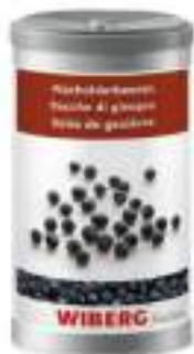
BACCHE GINEPRO WIBERG