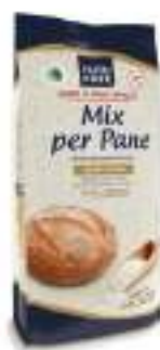
MIX PANE SENZA GLUTINE KG 1