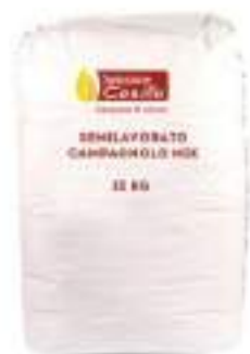
FARINA MIX RUSTICO CAMPAGNOLO