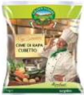
CIME DI RAPA CONG. KG 1