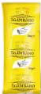
FARFALLE SGAMBARO KG 5