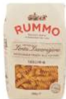
FUSILLI 48 RUMMO 500G