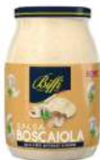
SALSA BOSCAIOLA VETRO 960