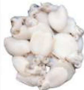
SEPIE INDO PAC. 1/2 PP