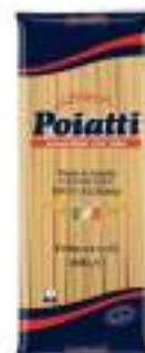
POIATTI FETTUCCE 12 KG 1