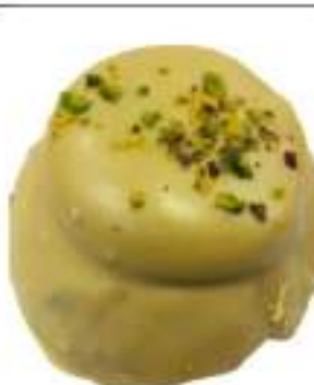
RAME DI NAPOLI PISTACCHIO 3 KG