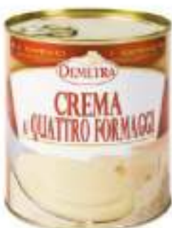
CREMA DI 4 FORMAGGI 4/4