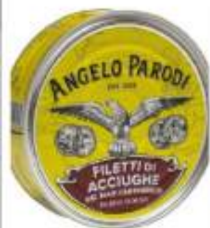
FIL. ALICI MAR CANTABRICO 550G