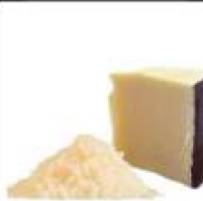
PECORINO ROMANO GRATTATO