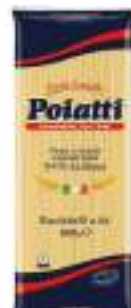
POIATTI RUSTICHELLI 4A KG 1