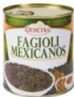
FAGIOLI MEXICANOS 4/4