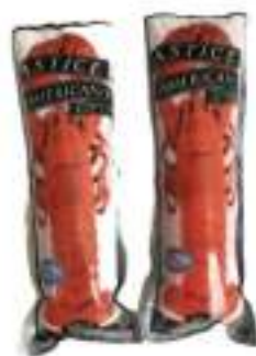
ASTICE TUBO P/COTTO