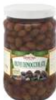
OLIVE LECCINO DEN. VASO 1700