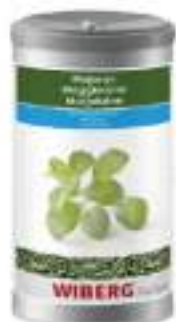
MAGGIORANA LIOF. WIBERG