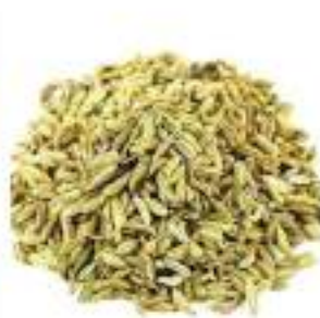
FINOCCHIO SEMI CONF.KG.1