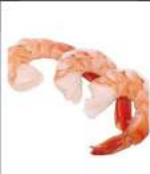
GAMBERI CODE G. 800 INDOPAC.