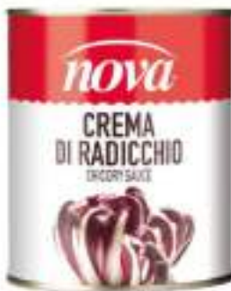
PORCINO CHEF FUNGHI TRIF. 4/4