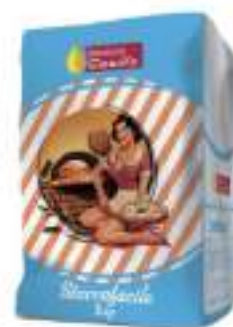
STACCA PIZZA MIX KG 5