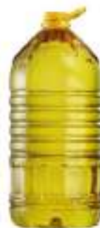
OLIO GIRASOLE ALTO OLEICO L 10