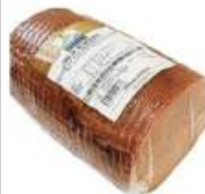
FILETTO PESCE MARLIN AFFUMICAT