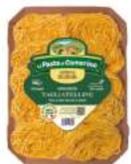
TAGLIATELLE UOVO VASSOIO G.500