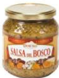
SALSA DEL BOSCO VD 500 ML