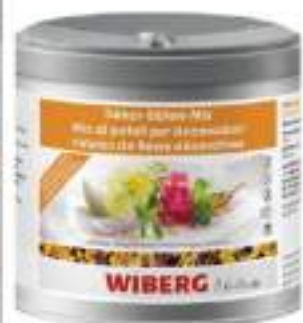
MIX DI PETALI X DECOR. WIBERG