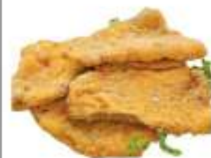
COTOLETTE PESCE SPADA KG 4 VASC.