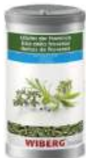
ERBE DELLA PROVENZA WIB.