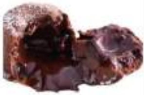
CUOR DI CIOCCOLATO FONDATE