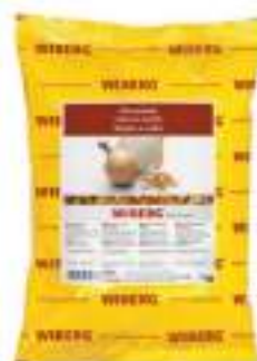
CIPOLLE ARROSTITE TRITATE WIBE