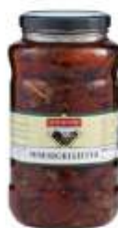
POMODORI SECCHI OLIO 3100 ML