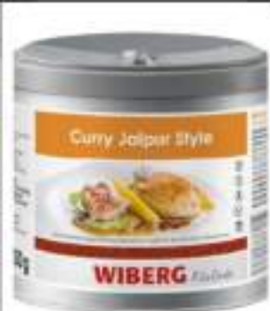
CURRY JAIPUR WIBERG