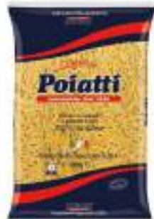
POIATTI RUSTICHELLI SPEZZATI 20A KG 1