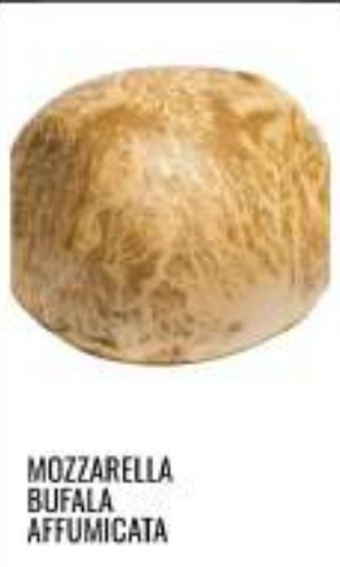
MOZZARELLA BUFALA AFFUMICATA