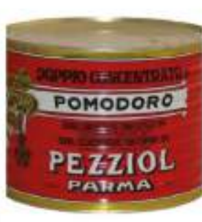
CONCENTRATO POMODORO K.1