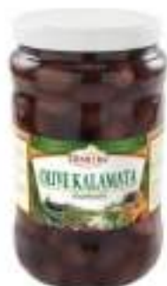
OLIVE KALAMATA MARINATE 1700