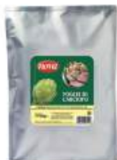
FOGLIE CARCIOFO OLIO BUSTA 1.7