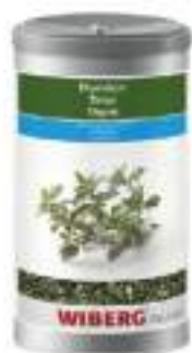
ANETO LIOFILIZZATO WIBERG