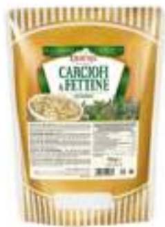
CARCIOFI FETTE TRIF. BUSTA 700