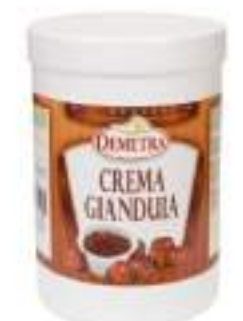
CREMA DI GIANDUIA KG 1