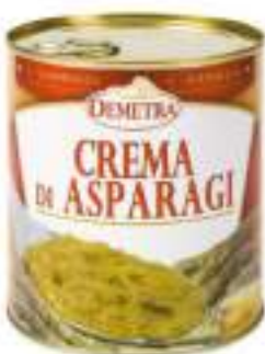
CREMA DI ASPARAGI LATT.4/4