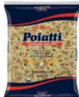
POIATTI SPACCATELLE 59 KG 1