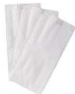
SACCHETTI BIANCHI 40G 12X24