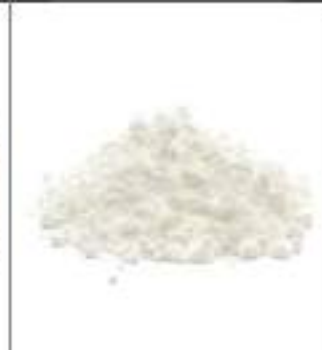
ZUCCHERO A VELO KG 1