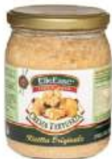
CREMA AL TARTUFO VASO GR.500