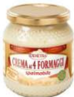
CREMA 4 FORMAGGI VASO 500G