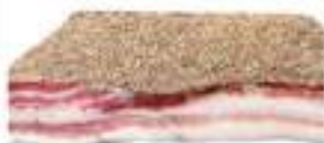
PANCETTA STAG. SUINO SCARPACCIA