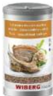
MAIALE RUSTICO SALE AROMATICO