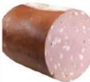
MORTADELLA 1/2 CILIND. KG 3 PS