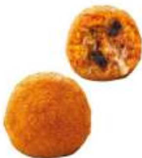
ARANCINI NORMA 220G 30 PZ CRUDI