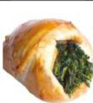
CARTOCCIATE SPINACI 165G 25PZ