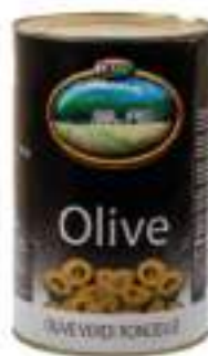
OLIVE VERDI RONDELLE KG.2 SGOC