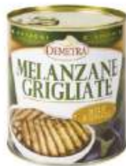
MELANZANE GRIGLIA O.G.4/4