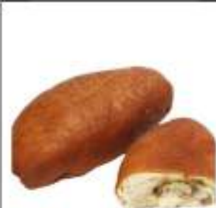
SICILIANE TUMA ACCIUGHE 180G 20 PZ COTTE