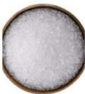
SALE MARINO FINE KG.1