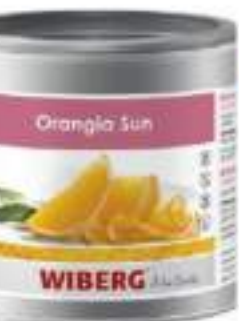
ORANGIA SUN PREP. AROM.