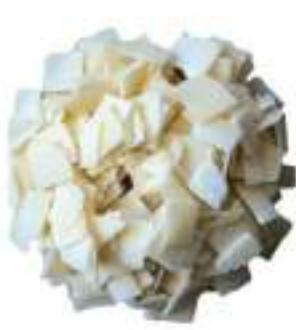
GRANA PADANO SCAGLIE KG 1