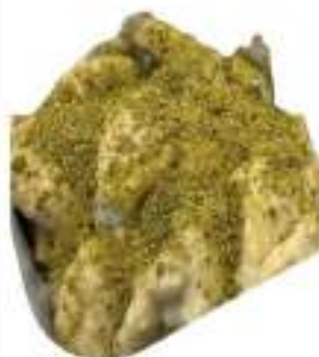
PANZOTTI PISTACCHIO 2,5 KG