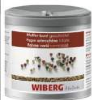
PEPE ARLECCHINO IN GRANI