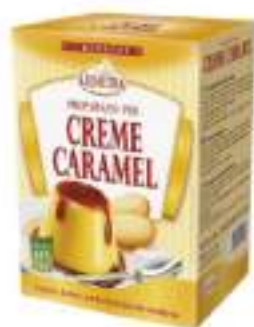
CREM CAMEL 10 BST