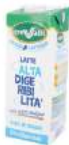
LATTE SENZA LATTOSIO L 1