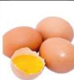
UOVA FRESCHE P. GIALLA L X90