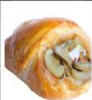
CARTOCCIATE FUNGHI 165G 25 PZ