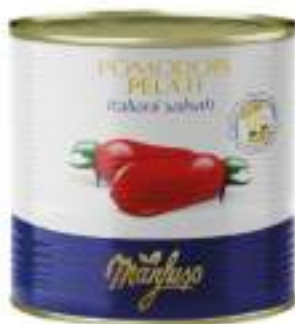
POM. PELATI MANFUSO LATTA 3/1