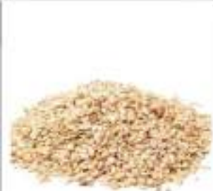
PEPE BIANCO IN GRANI CONF.KG.1