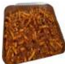
PASTA ALLA CATANESE 2,5KG VASC.