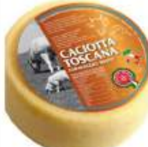
CACIOTTA TOSCANA MISTA