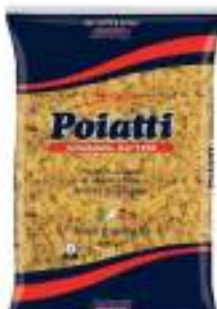
POIATTI DITALI RIGATI 30 KG 1