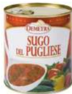
SUGO DEL PUGLIESE LATT.4/4