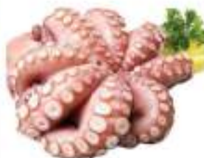
POLPO IQF CONG. T6 INDO