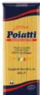
POIATTI SPAGHETTI BRONZO 3 KG 1