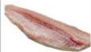
PANGASIO FILETTI CONG.