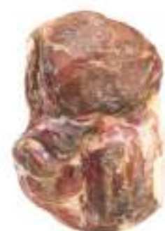
GRAN COSCIOTTO DIS. QUADRATO