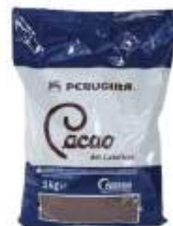
CACAO AMARO SACCH.KG.1