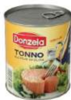
TONNO OLIO OLIVA G. 800