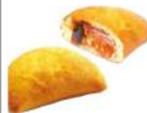
DIABOLE 210G 20PZ