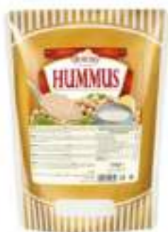
HUMMUS DI CECI BUSTA 700