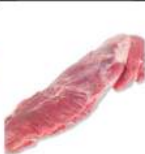
FILETTO BOVINO ADULTO S/V