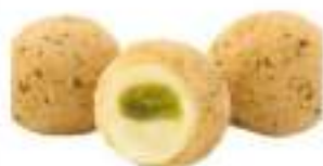
MOZZARELLA CUORE DI PESTO G.20 KG5 COTTE