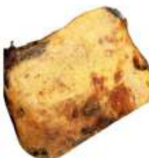
PARMIGIANA MONO G.250G CA