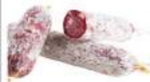
SALAME TOSCANO SCARPACCIA