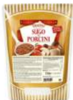
SUGO DI FUNGHI PORCINI busta 700