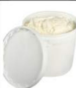
CREMA RICOTTA ZUCCH.CONG. KG 1