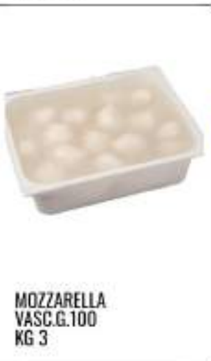
MOZZARELLA VASC.G.100 KG 3