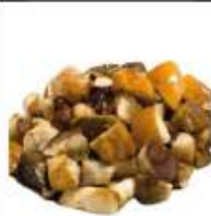
PORCINI CUBETTATI CONG.