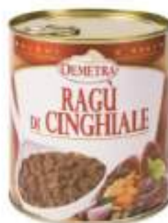
RAGÙ DI CINGHIALE LATT.4/4