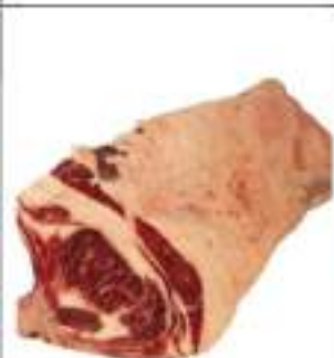
ROASTBEEF SCOTTONA BAVARESE