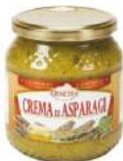
CREMA ASPARAGI VASO 500G