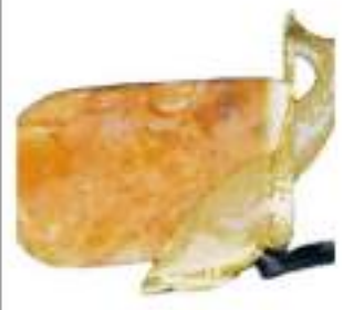
SALMONE RITAGLI BUSTE GR.500