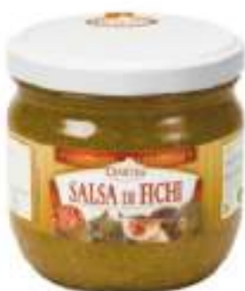
SALSA DI FICHI VST 370 ML