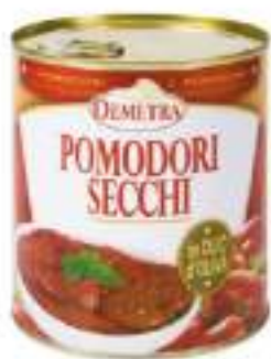
POMODORI ESSICATI La.4/4