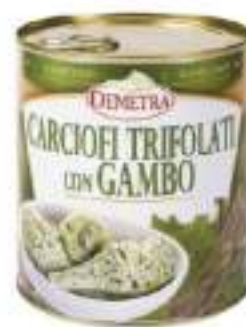
CARCIOFI TRIF. INT. DEMETRA L.3/1