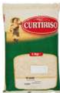
RISO ORIGINARIO CURTI KG 5