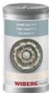
SALE ROSA FINO NON IODATO