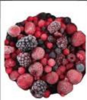
FRUTTI DI BOSCO CONG