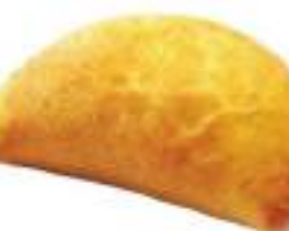
SICILIANE POMOD/MOZZARELLA 180G 20PZ