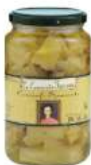
CARCIOFI SPACC.RINF.OLIO 3100M