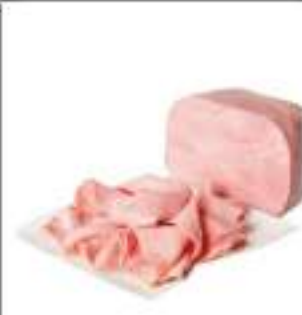
COTTO GO. 1/2 SGRASSATO