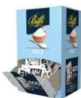
SALE MONODOSE 1 G 500 PZ