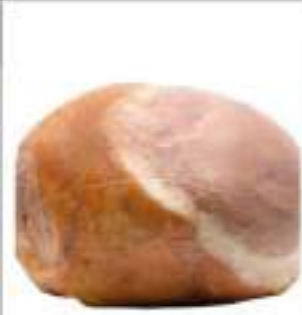
PROSC. COTTO SCELTO VERDE