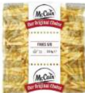
PATATE STICK MC/CAIN CONG.