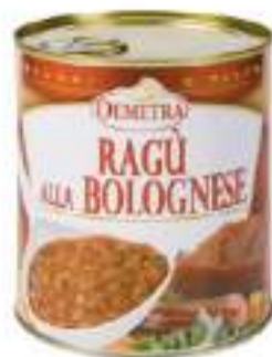
RAGÙ ALLA BOLOGNESE LATTA 4/4