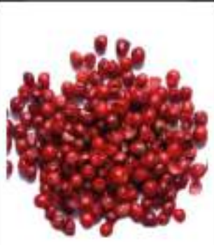
PEPE ROSA IN GRANI KG 1