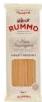
SPAGHETTI GROSSI 5 RUMMO KG 1