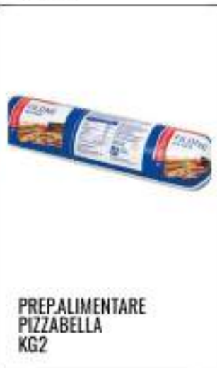
PREPALIMENTARE PIZZABELLA KG2