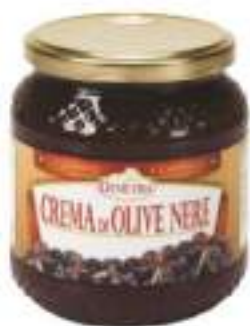
CREMA OLIVE NERE VASO 500G