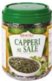
CAPPERI AL SALE KG 1 DEMTRA