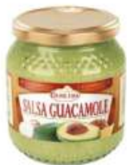
SALSA GUACAMOLE VASO 500