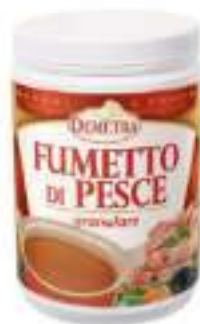
FUMETTO DI PESCE DEMETRA