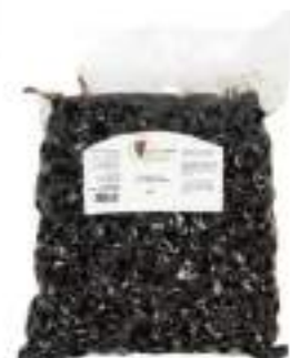
OLIVE NERE AL FORNO SAC. KG 5