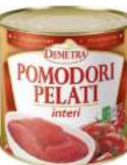
DEMETRA POMODORI PELATI 3/1