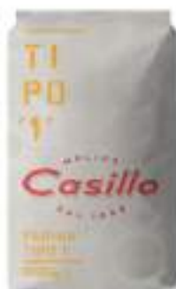
FARINA TIPO 1 MACINATA PIETRA