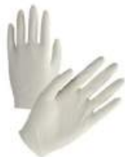
GUANTI LATTICE CONF.100 PZ