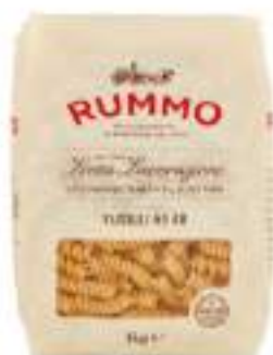
FUSILLI 48 RUMMO KG 1