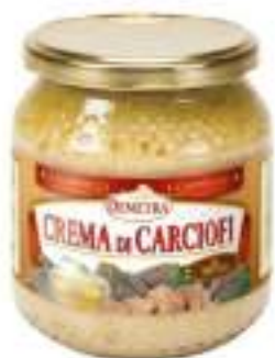
CREMA CARCIOFI VASO 500G