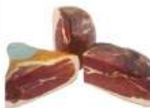
PROSCIUTTO DISSOSSATO TRANCI