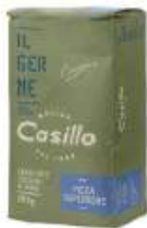
FARINA TIPO O PIZZA SUPERIORE