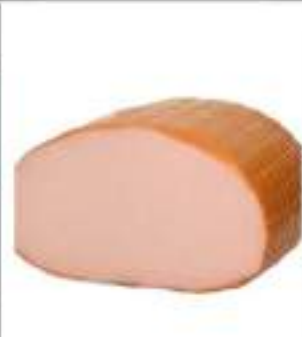
TACCHINO ARROSTO 1/2