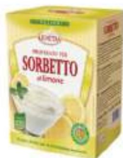
SORBETTO AL LIMONE 2X 1 KG