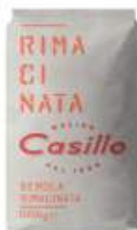
FARINA DI SEMOLA RIMACINATA KG