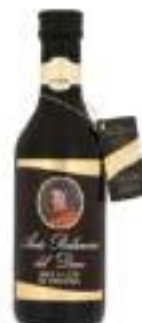
ACETO BALS.DEL DUCA 250 M