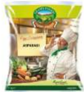
ASPARAGI 16/20 CILE 10X1 KG