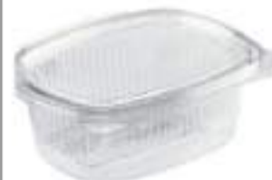
CONTENITORI MULTIF. CC750X40PZ