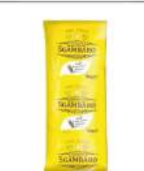
SEDANI RIGATI SGAMBARO KG 5