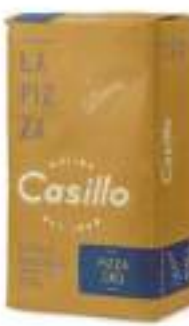
FARINA SEMOLA PIZZA ORO KG 25