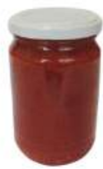
UOVA LONPO ROSSE 350 GRAMMI