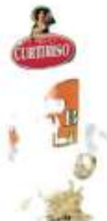
RISO FINO PARBOILED KG.1X5