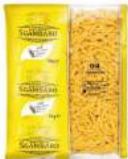
CASERECCO SGAMBARO KG 5