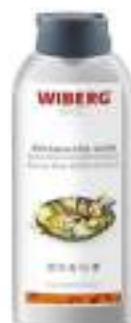
WOK SAUCE AGRODOLCE WIBERG