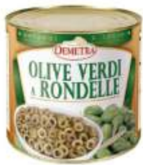
OLIVE VERDI RONDELLE LATTA 3/1