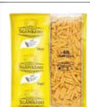
PENNE PICCOLE SGAMBARO KG 5