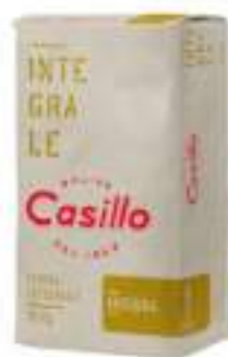
FARINA INTEGRALE FINE KG 25