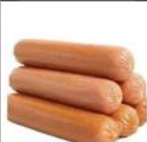
WURSTEL POLLO TACCHINO G.100