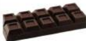
CIOCCOLATO FOND.CUBI 70% KG 4