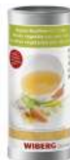
BRODO VEGETALE CON SALE ROSA