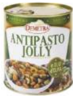
ANTIPJOLLY DEMTRA OL.GIR.4/4