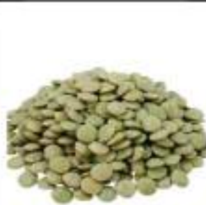
LENTICCHIE VERDI SECHE KG 5