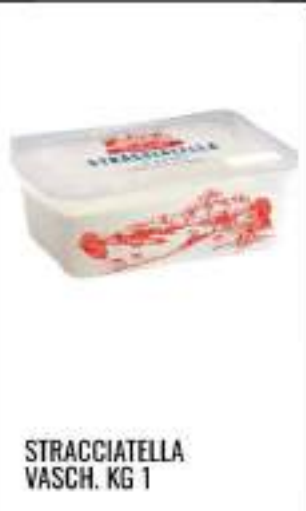
STRACCIATELLA VASCH. KG 1