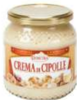
CREMA DI CIPOLLA VASO 500