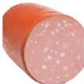
MORTADELLA OVALE PS G/FETTA Sp