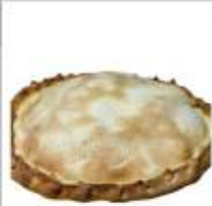
SCACCIATA TUMA ACCIUGHE 1,5 KG