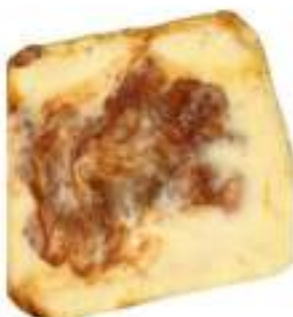
LASAGNE PASTICCIATE 2,7 KG