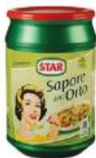
PREP. PER BRODO ORTO STAR