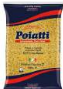
POIATTI DITALINI RIGATI 27 KG 1