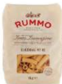
ELICOIDALI 49 RUMMO KG 1