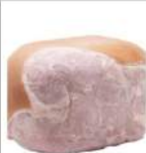
PROSC. COTTO SCELTO QUICK 85