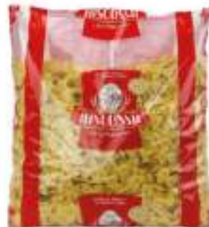
FARFALLE RISCOSSA KG 3