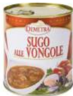
SUGO ALLE VONGOLE LATT.4/4