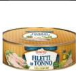
TONNO YF TRANCI TAMB. 1,800