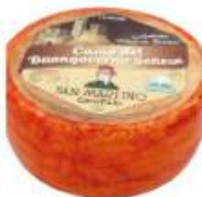
PECORINO S.MARTINO ROSSO