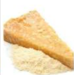
PARMIGIANO REGG. GRATTATO 100G