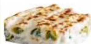
CANNELLONI RICOTTA SPINACI 2,4 KG