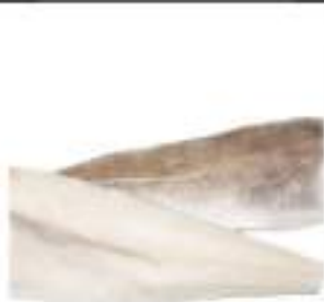
MERLUZZO NORD.FILETTO 500 UP