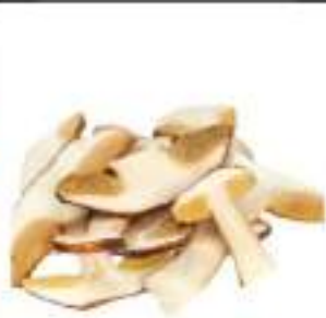
PORCINI SURG. LAMELLE