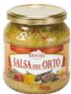
SALSA DELL'ORTO VASO 500 ML