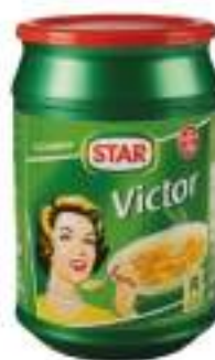
PREP. X BRODO VICTOR STAR