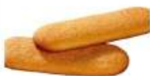
BISCOTTINI DI NOVARA G. 450