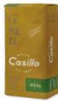
FARINA TIPO 1 SPECIAL AROMA