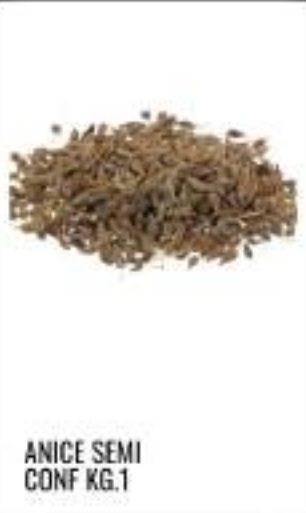
ANICE SEMI CONF KG.1