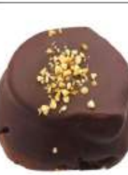
RAME NAPOLI CREMA NOCCIOLE 3 KG