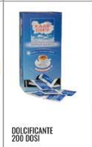
DOLCIFICANTE 200 DOSI