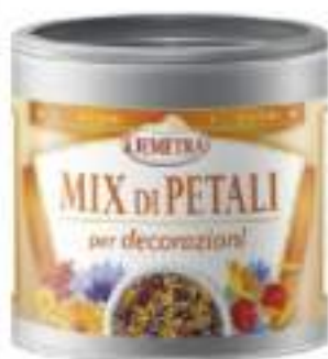
MIX PETALI DECORAZIONI DEMETRA