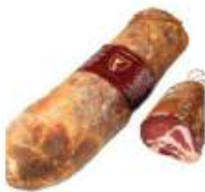
CAPOCOLLO SUINO INCARTATO