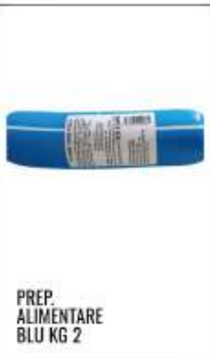
PREP. ALIMENTARE BLU KG 2