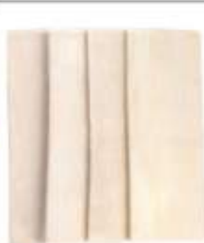
PASTA SFOGLIA BIANCA SURG.