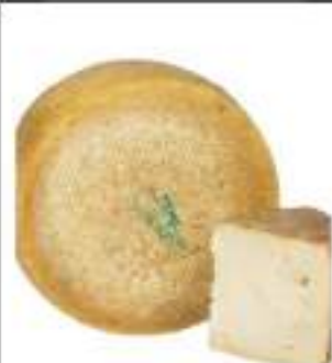
PECORINO SARDO MATURO