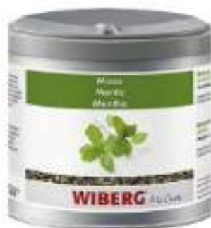
MENTA ESSICCATA WIBERG