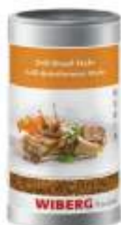
GRILL BRASIL STYLE WIBERG