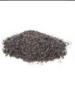
PAPAVERO SEMI CONF.KG.1