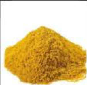
CURRY IN POLVERE CONF.DA 1 KG