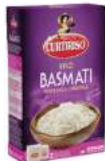
RISO BASMATI INDIANO KG 1X5