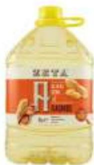
OLIO ARACHIDE PET L 5