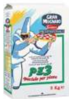
FARINA SPECIALE PER PIZZA PZ3