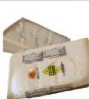
GRANA PADANO SCELTO KG 1