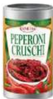
PEPERONI CRUSCHI BRT 1200