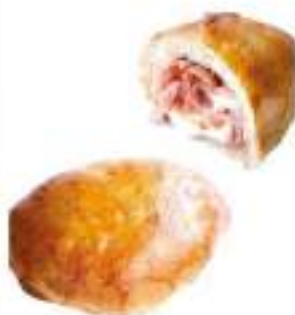
CARTOCCIAE PROSC/MOZZ.165G 25PZ COTTE