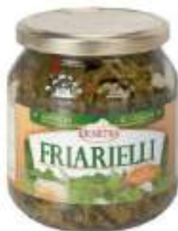
FRIARELLI IN OLIO 500 ML VASO