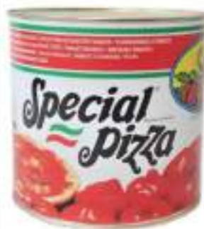
POLPA POMODORO 3/1 LATTA