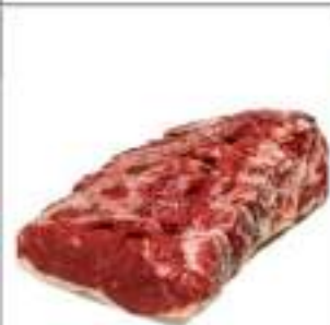
CONTROFILETTO SCOTTONA SIRLOIN 6+