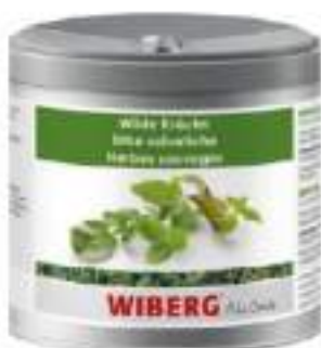
ERBE SELVATICHE ESSICcate