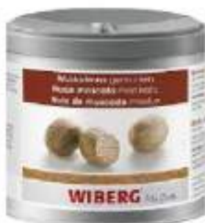
NOCE MOSCATA MACINATA