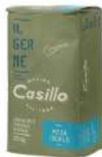
FARINA TIPO OPIZZA IDEALE