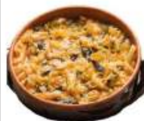
MINESTRA DI PANE VASCHETTA