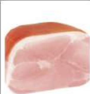
COTTO VERONA SGRASSATO