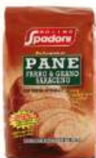
FARINA DI FARRO E GRANO SAR KG