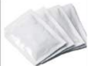
ZUCCHERO DI CANNA BUS.G 5