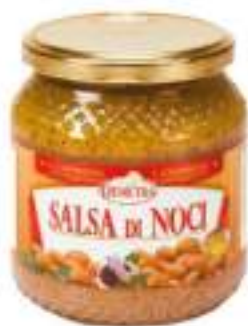
SALSA DI NOCI VASO V.500