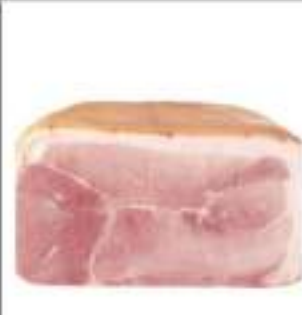
PROSC COTTO SCELTO QUICK 1/2