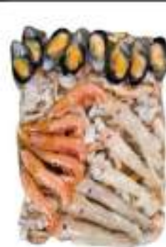
MISTO SCOGLIO CONG. BUSTA