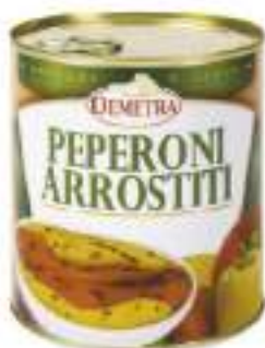
PEPERONI ARROSTITI 4/4