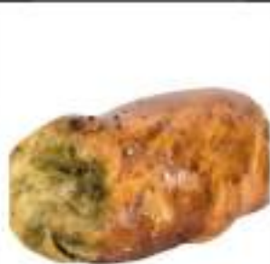
CARTOCciate PISTACCHIO 165G 25PZ