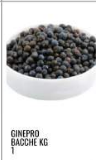
GINEPRO BACCHE KG 1