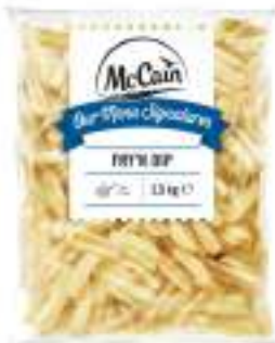
PATATE FRY N DIP SKIN CONG.