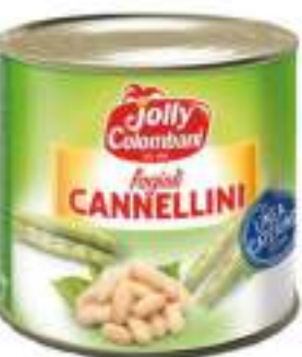
FAGIOLI CANNELLINI LATTA 3/1