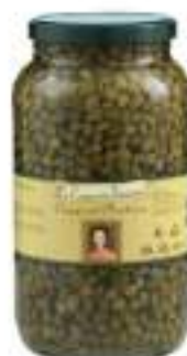
CAPPERI PUNT.ACETO VASO 3100 M