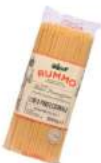
SPAGHETTINI RUMMO KG 1