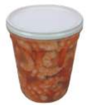
GAMBERETTI VASO GR.900 LUXUS A