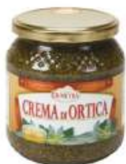
CREMA DI ORTICA VASO 500 ML