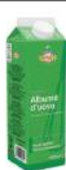
ALBUME UOVO BRIK 1 L