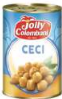
CECI JOLLI G. 400