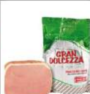
COTTO S/POL GRANDOLCEZZA