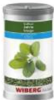
SALVIA ESSICCATA WIBERG