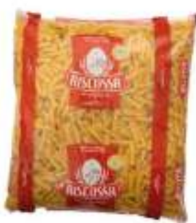
CANNERONI RIGATI RISCOSSA KG 3