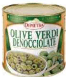
OLIVE VERDI DENOCC.SALAM.La 3/1