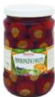
PEPERONCINI FARCITI 1,7 ML