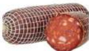
SALAME PICCANTE 1/VENTRIC.KG.3