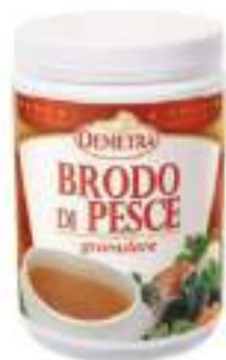
PREP. BRODO DI PESCE DEMETRA