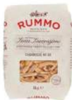
CASARECCE 88 RUMMO KG 1