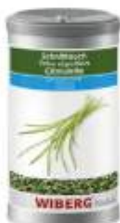
ERBA CIPOLLINA WIBERG