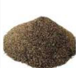
PEPE NERO MACINATO KG.1