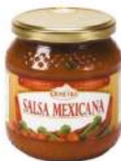
SALSA MEXICANA VD 500 ML