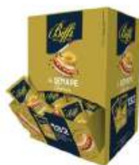
SENAPE BUSTINE MONODOSE