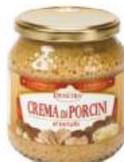
CREMA PORCINI TARTUFO VASO 500