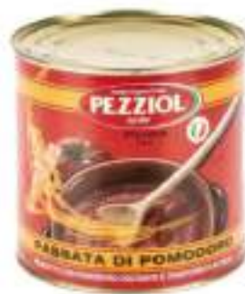
PASSATA DI POMODORO PEZZIOL K3