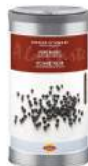
PEPE NERO MACINATO GROSSO