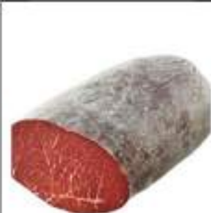
BRESAOLA P. D'ANCA 1/2SV