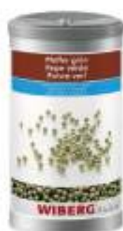
PEPE VERDE LIOFILIZZATO GRANI