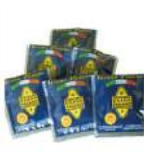
GRANA PADANO GRATT. BUST. 5G