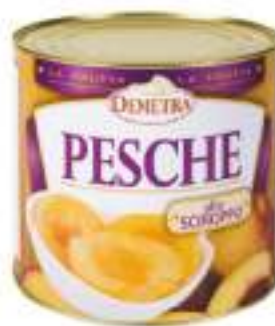
PESCHE SCIROPATE 4/4