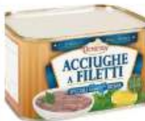
FILETTI ACCIUGHE OLIO GIR 4/4