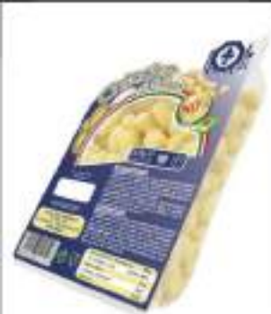
CHICCHE PATATE 500G