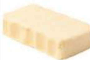
BURRO PANI da kg 1