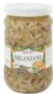
MELANZANE FIL.OL GIR.V.V 1700