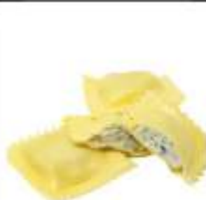
RAVIOLI RICOTTA VERDURA CONG.