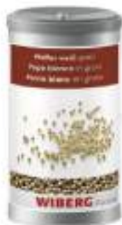
PEPE BIANCO IN GRANI WIBERG