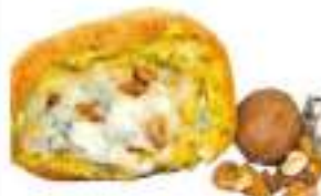
ARANCINI GORGONZOLA/NOCI 220G 30PZ CRUDI