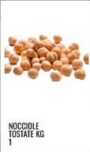
NOCCIOLE TOSTATE KG 1