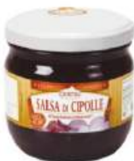
SALSA DI CIPOLLE VST 370 ML