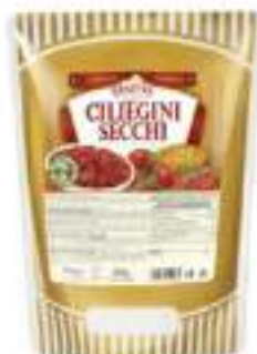
POMODORI CILIEGINI SECCHI B 700