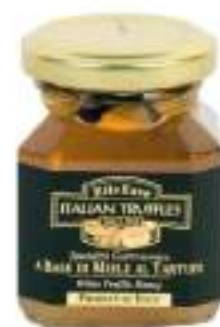
MIELE E TARTUFO NERO 130G