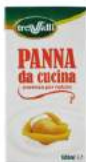
PANNA CUCINA ML 500