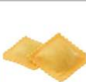
TORTELLI PATATE CONG.