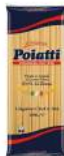
POIATTI LINGUINE CHEF 10A KG 1