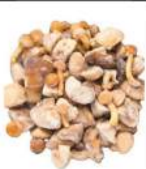
MISTO FUNGHI SURGELATI