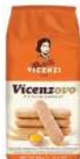
SAVOIARDI VICENZI G. 400