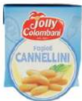
FAGIOLI CANNELLINI TRK 380G