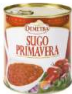
SUGO DI PRIMAVERA LATTA 4/4