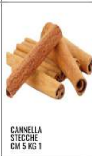
CANNELLA STECHE CM 5 KG 1