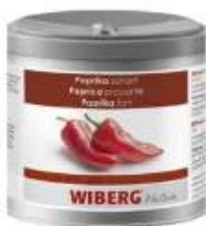
PAPRIKA PICCANTE WIBERG