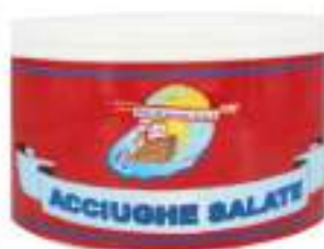
ACCIUGHE LATTA K.5