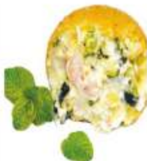
ARANCINI GAMBERI/ZUCCHINE 220G 30 PZ CR