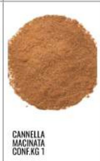
CANNELLA MACINATA CONF.KG 1