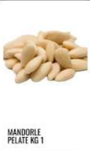
MANDORLE PELATE KG 1