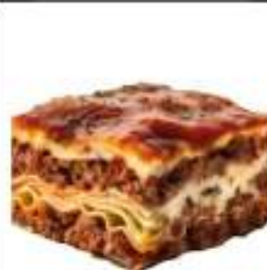
LASAGNE SURG. VASCHETTA