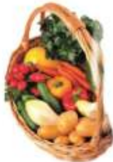
SPINACI CUBETTI BUSTA 4X2,5