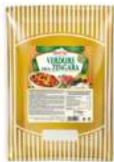
VERDURE ALLA ZINGARA BUSTA 1.7