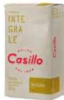
FARINA INTEGRALE KG 25