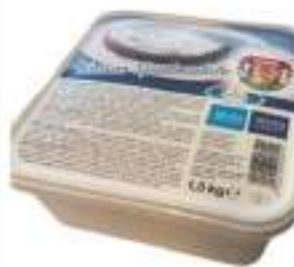
SPALMABILE FRESCO NAT KG1,5