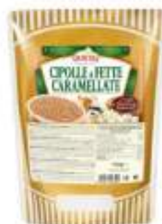
CIPOLLE CARAMellate BUSTA 700