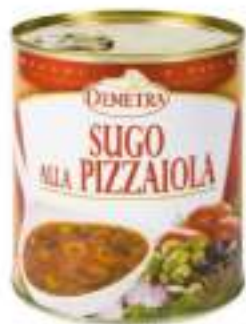
SUGO ALLA PIZZAIOLA LATT.4/4