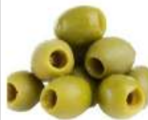
OLIVE VERDI DEN. KG 2 SGOCC.