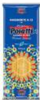
POIATTI MARGHERITE 13 500G