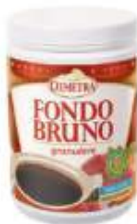
PREP.PER FONDO BRUNO G. 500