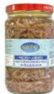
PEZZI DI ACCIUGA VASO 1,7 ML