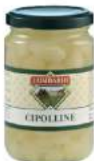
CIPOLLINE PERLINE ACETO V.720