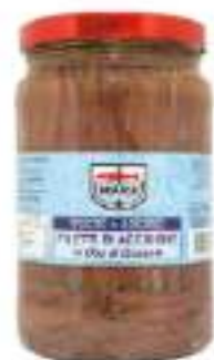
FILETTI ACCIUGHE OLIO GIR. 720