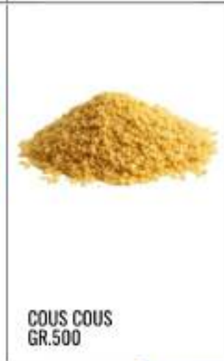
COUS COUS GR.500