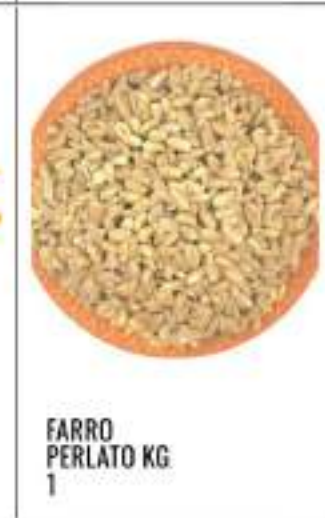
FARRO PERLATO KG 1