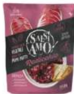
CREMOSITA' RADICCHIO CHEF800BST