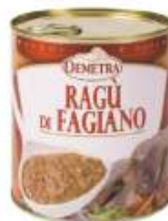
RAGÙ DI FAGIANO LATT.4/4