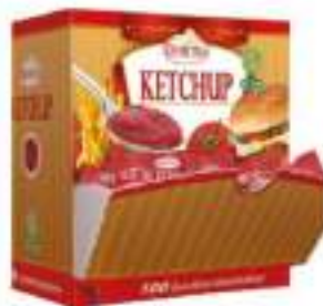
KETCHUP BUSTINE 12G DEMETRA