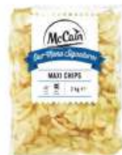
PATATE PROFESSIONAL PIZZOLI