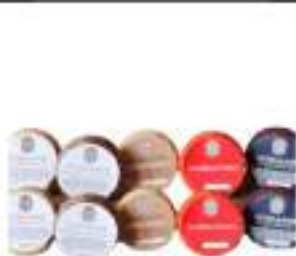
ESPOSITORE SFIZI MIX PECORINI 48 PZ