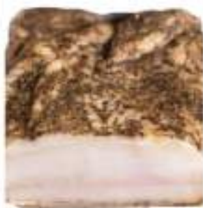
LARDO SUINO TRANCI