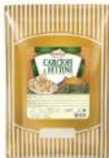
CARCIOFI FETTE BST 1,7 OLIO