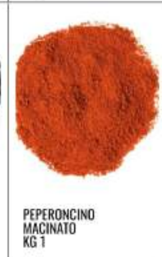
PEPERONCINO MACINATO KG 1