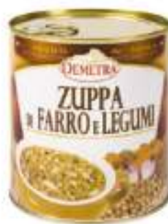
ZUPPA DI FARRO 4/4