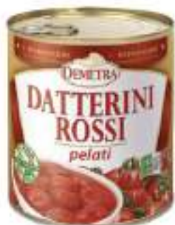
DATTERINI ROSSI PELATI 4/4