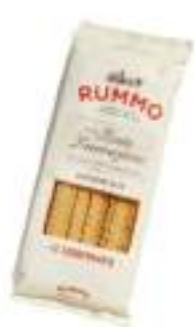
MAFALDINE RUMMO G.500