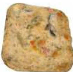
LASAGNE VEGETARIANE 2,7 KG