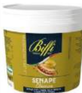
SENAPE SECCHIO KG 5