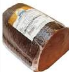
FILETTI DI TONNO AFFUMICATO