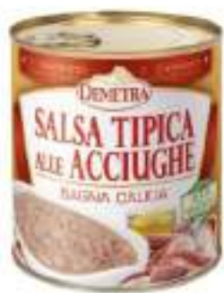
SALSA ACCIUGHE BAGNA CAUDA 4/4