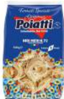
POIATTI NIDI MEDI 72 G.500