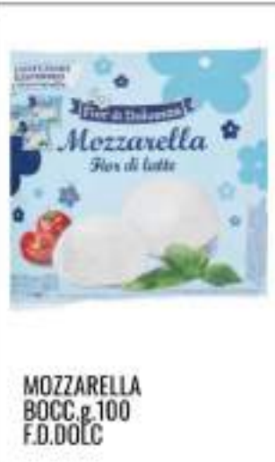
MOZZARELLA BOCC. g.100 F.D.DOLC