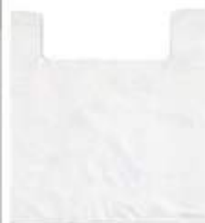
SHOPPER 27X50 CT 500PZ G.8