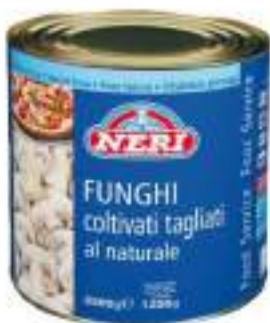
FUNGI CHAMPIGNONS NAT.3/1