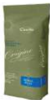
MIX CEREAL PIZZA ORIGINE