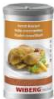
POLLO CROCCANTINO SALE AROM. WI