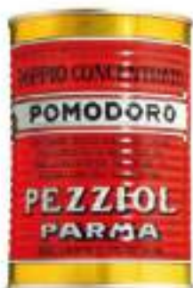
CONCENTRATO POMODORO KG 0,5