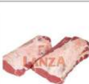
ROASTBEEF CONTROFILETTO LANZA ES.