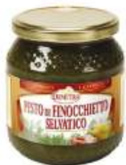
PESTO FINOCCHIETTO SELV. G 500