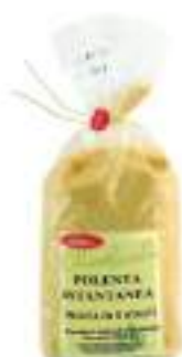
POLENTA ISTANTANEA GR. 500