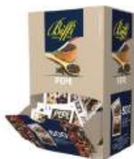
PEPE MONODOSE 1 G X500PZ