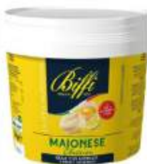
MAIONESE "SECCHIO" KG 5