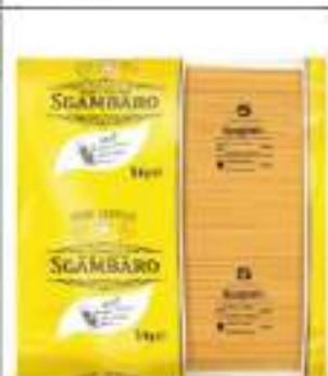
SPAGHETTI SGAMBARO KG 5