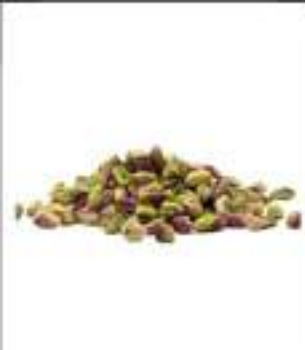
PISTACCHI SGUSCIATI MED KG 1