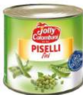
PISELLINI FINI LATTA 3/1