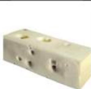
FORMAGGIO A TRANCI TIPO EMENT.