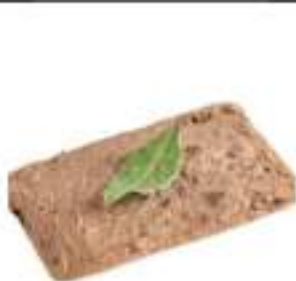
PATE DI FEGATO TOSCANA VASCH.