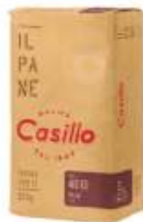
FARINA 400 PLUS KG 25