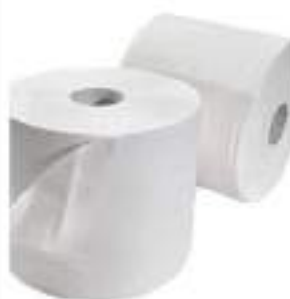
BOBINA OVATTA X2