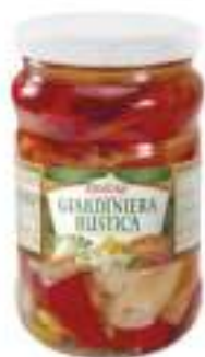
GIARDINIERA 1700 ML