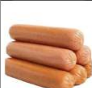
WURSTEL POLLO TACCHINO 83X3 PZ