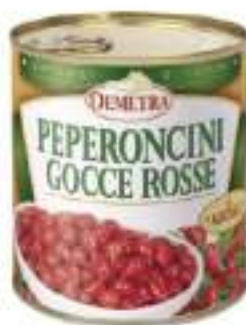
PEPERONCINI GOCCE ROSSE 4/4