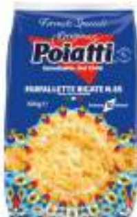
POIATTI FARFALLETTE RIGATE 85 G.500