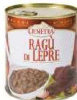
RAGÙ DI LEPRE LATT.4/4