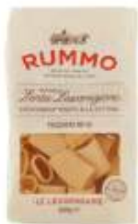
PACCHERI 111 RUMMO 500G