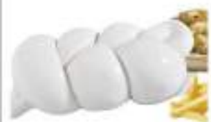
TRECCIA DI BUFALA FATTORIA