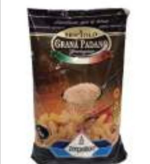
GRANA PADANO GRATTATO KG 1