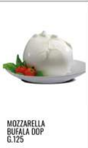
MOZZARELLA BUFALA DOP G.125