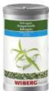
DRAGONCELLO LIOF. WIBERG