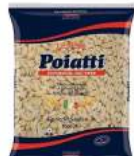
POIATTI GNOCCHETTI SARDI 34 KG 1