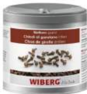
CHIODI GAROFANO INTERI WIBERG