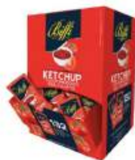
KETCHUP GAIA BUST. G. 12