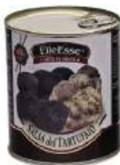
SALSA DEL TARTUFAIO latta 4/4