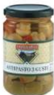
ANTIP. 3 GUSTI VASO 3100 ML