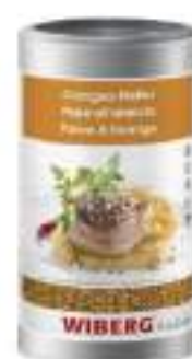
PEPE ALL'ARANCIO WIBERG