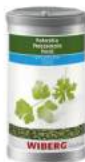
PREZZEMOLO LIOF. WIBERG