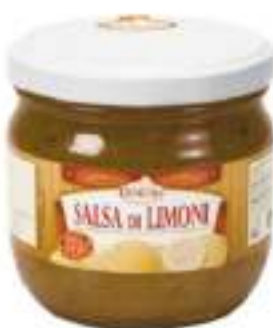
SALSA DI LIMONI VST 370 ML