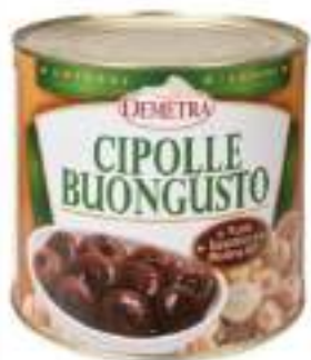
CIPOLLINE AGRODOLCE BUONG.4/4