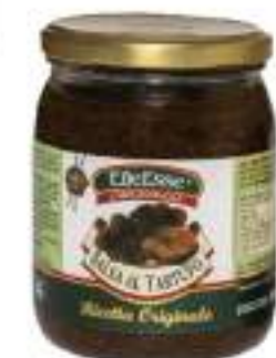
SALSA TARTUFATA NERA GR 500