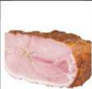
PROSCIUTTO ALLA GRIGLIA 1/2 SV