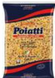
POIATTI ANELLI SICILIANI 33 KG 1