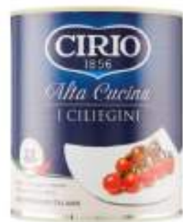
POMODORINI CIRIO KG 1