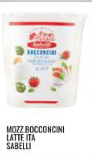
MOZZ. BOCCONCINI LATTE ITA SABELLI