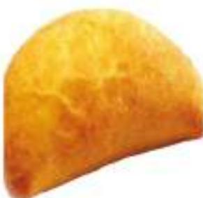
SICILIANE PROSC/FORMAG. 180G 20PZ COTTE