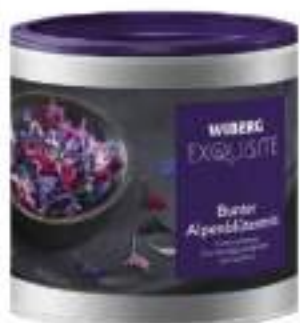
MIX FIORI ALTO ADIGE WIBERG