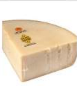
GRANA PADANO SCELTO 1/8