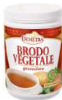
BRODO VEGETALE GRAN. DEMETRA