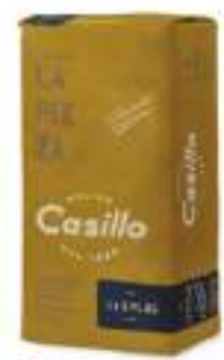
FARINA LA 8 PLUS