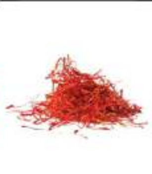
ZAFFERANO PURO BUSTINE 12 CGr