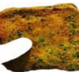
MOZZARELLA IN CARROZZA MORT/PISTAC 170G