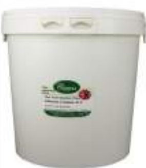
OLIVE VERDI NOCELLARA SCHIACC. KG 4