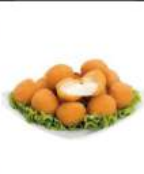
MOZZARELLE PANATE 4X2,5 KG