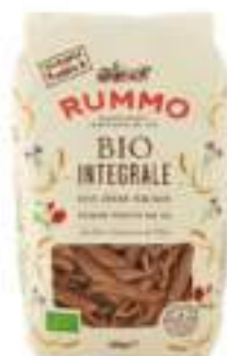
PENNE RIG. RUMMO INTEGRALI BIO