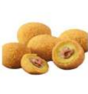
OLIVE ASCOLANA CONG. 4X2,5 KG