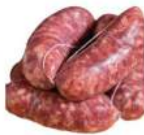
IMPASTO SALSICCIA SCARPACCIA