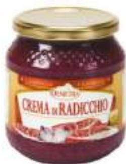
CREMA DI RADICCHIO VASO 500G