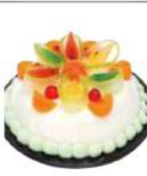
TORTA CASSATA SICILIANA 1,2