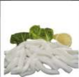
FETTUCCE TOTANO BUSTA