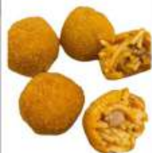
FRITTATINA AMATRICIANA G.50 KG 5 COTTA