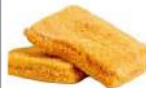
MOZZARELLA IN CARROZZA 170G 30 PZ CRUDE