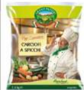
CARCIOFI SPICCHI BUSTA