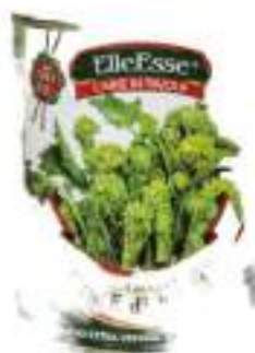
FRIARELLI CIME DI RAPA G. 800