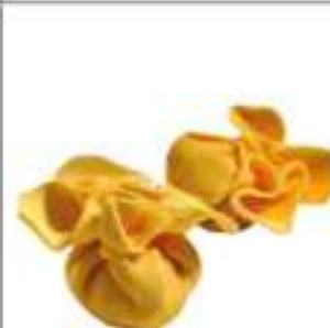
FIOCCHI FORM. E PERE