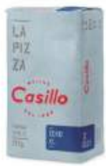
FARINA CASILLO 0 flour blu 25kg