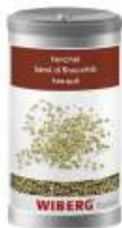
SEMI DI FINOCCHIO WIBERG