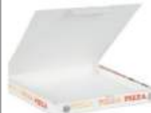
SCATOLE PER PIZZA 33X33 100 PZ