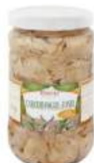
CARCIOFI FOGLIE FONDI vaso1700