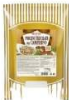
PORCINI CAMPESINO BST 1700G