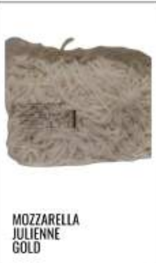
MOZZARELLA JULIENNE GOLD