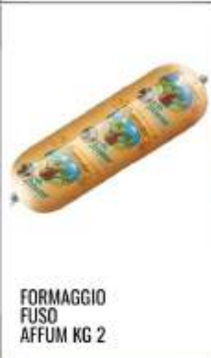
FORMAGGIO FUSO AFFUM KG 2