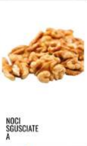
NOCI SGUSCIATE A