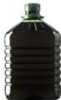
OLIO DI SANSÀ E DI OLIVA LT 5