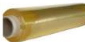
PELLICOLA 300 MT