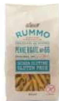
PENNE 66 GLUTEN FREE RUMMO