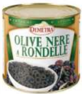
OLIVE NERE A RONDELLE 3/1