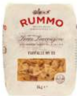
FARFALLE 85 RUMMO KG 1