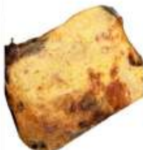
PARMIGIANA DI MELANZANE 1,9 KG