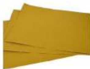
CARTA PAGLIA ALIM. CT X10 KG