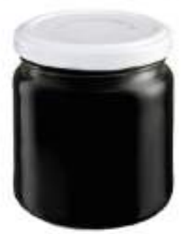
NERO DI SEPPIA BAR. G. 500