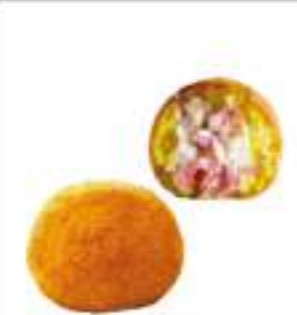
ARANCINA PREFRITTA MOZZARELLA E PROSCIUTTO GR.200X40