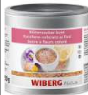
ZUCCHERO COLORATO AI FIORI WIBERG