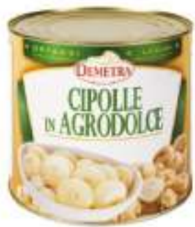
CIPOLLINE AGRODOLCE La.3/1