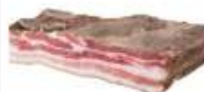
PANCETTA STESA S/V KG.1,5