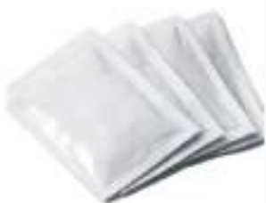
ZUCCHERO CANNA BUSTINE KG 10