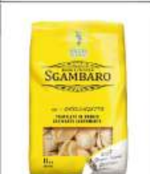
ORECCHIETTE SGAMBARO KG 5