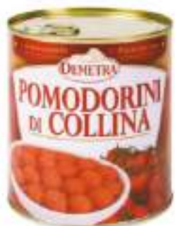
POMODORINI COLLINA LATTA 4/4