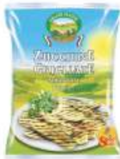
ZUCCHINE ARR. GRIG. 1 KG