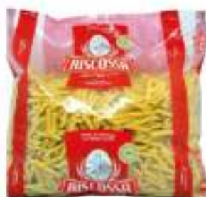
PENNE ZITE RIG. RISCOSSA KG 3