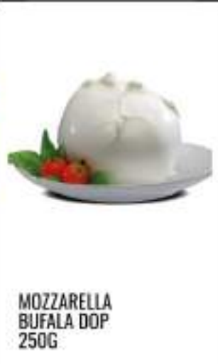
MOZZARELLA BUFALA DOP 250G