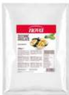
ZUCCHINE GRIGLIATE BUSTA 1700