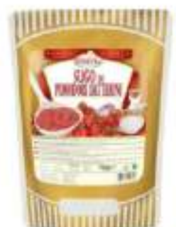
SUGO POM. DATTERINI BUSTA 700