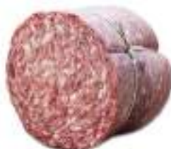
SBRICIOLONA GIGANTE 1/2 SV SCARPACCIA