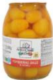
POMODORINO GIALLO NAT. VASO KG 1