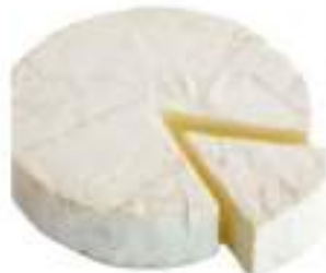
FORMAGGIO BRIE CONF.KG.1