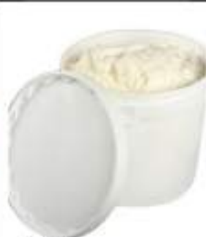
CREMA RICOTTA ZUCC. CONG. KG 3,5