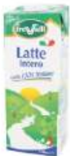
LATTE UHT INTERO 1Lx12 BRIK CT