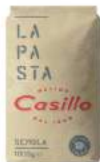
FARINA SEMOLA GRANO DURO