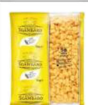
MEZZE MANICHE SGAMBARO KG 5