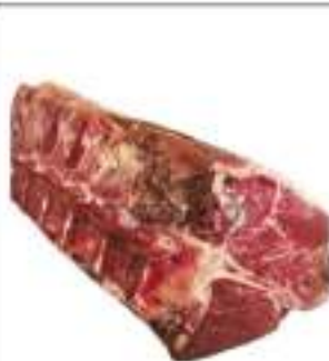
LOMBATA SCOTTONA MAREMMA