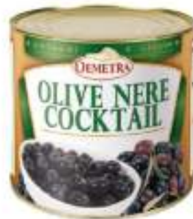
OLIVE NERE MEDIE SALAM.La 3/1