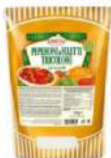
PEPERONI ARROST. TRIC. BST1700