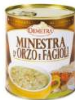
MINESTRA ORZO E FAGIOLI lat4/4