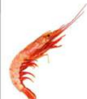
GAMBERI L2 ARGEN. CONG.