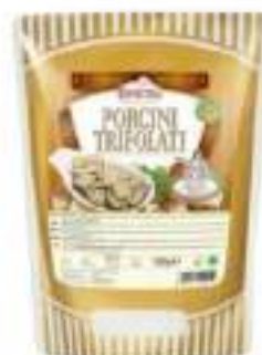
PORCINI TRIF.C'ERA UNA VOLTA