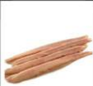
FIL ARINGHE AFFUM. 200G