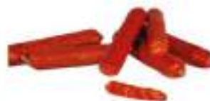
SALS. PICCANTE TRINITA'