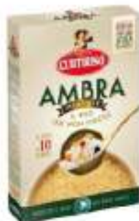
RISO AMBRA PARBOILED KG 1