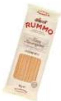
LINGUINE 13 RUMMO KG 1