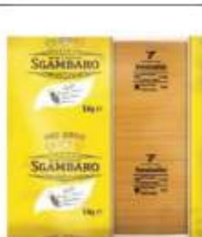
VERMICELLINI SGAMBARO KG 5