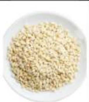
ORZO PERLATO KG 1