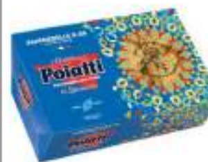
POIATTI PAPPARDELLE 88 G.500