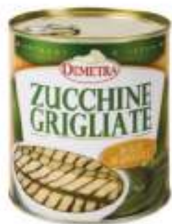
ZUCCHINE GRIGLIA O.G.4/4