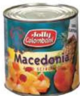
MACEDONIA 5 FRUTTI SCIROP. 3/1