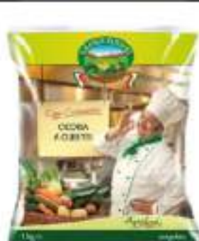
CICORIA CUBETTI CONG.