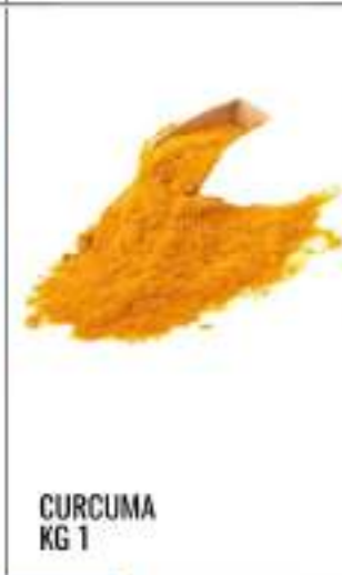
CURCUMA KG 1