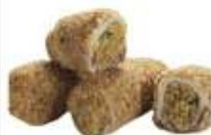
INVOLTINI PESCE SPADA 1,25 KG VASCH.