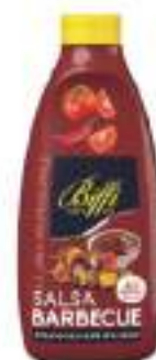
SALSA BARBECUE TWISTER 900G