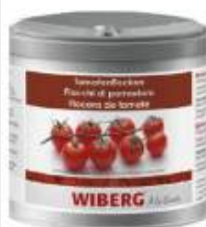
FIOCCHI DI POMODORO WIBERG