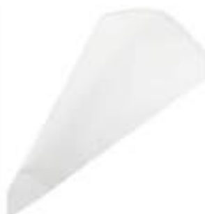
SACCO A POCHE DEMTRA 100 PZ