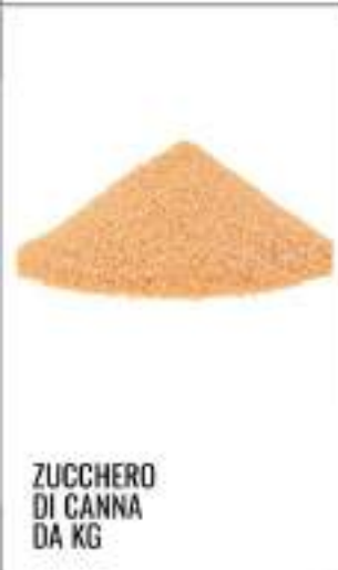
ZUCCHERO DI CANNA DA KG