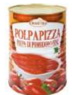
POLPA PIZZA DEMETRA 5/1