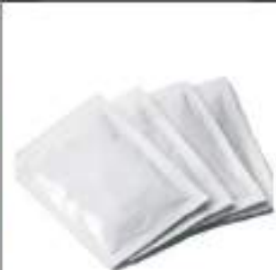
ZUCCHERO IN BUSTINE KG 10