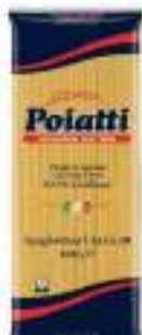
POIATTI SPAGHETTONI CHEF 4B KG 1