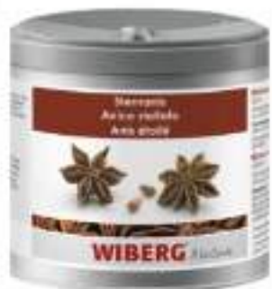
ANICE STELLATO INTERO