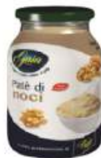
SALSA NOCI VASO VETRO