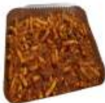
PASTA INCACIATA 2,8 KG