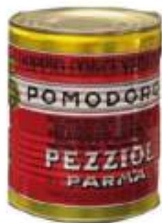
DOPPIO CONCENTRATO KG.2.2