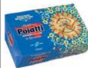
POIATTI PACCHERI RIGATI G.500