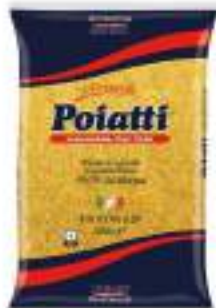
POIATTI FILI D'ORO 20 KG 1