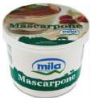
MASCARPONE VASCHETTA GR.500