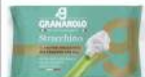
STRACCHINO 1000G GRANAROLO