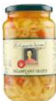
MELANZANE ALL'OLIO VASO 3100