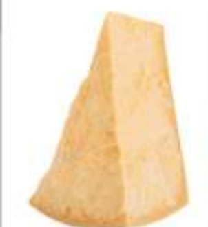
PARMIGIANO REGGIANO PORZIONI G. 200