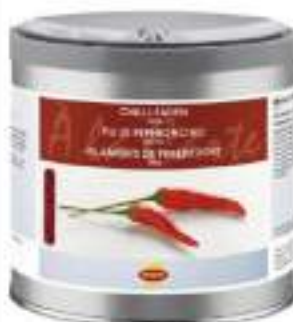
FILI DI PEPERONCINO SOTTILI