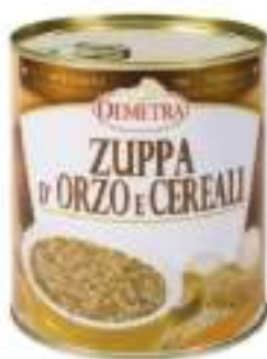
ZUPPA ORZO E CEREALI 4/4