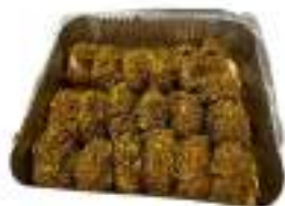
INVOLTINI CARNE PROSC. FORMAG. 1,25 KG