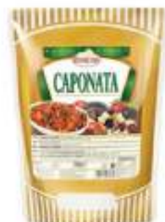
CAPONATA BUSTA 700