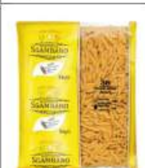
PENNE MEDIE RIG. SGAMBARO KG 5