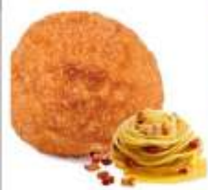
ARANCINI SPAGHETTI CARBONARA 220G 20PZ C