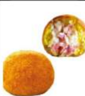
ARANCINETTI BURRO/PROSC. MIGNON