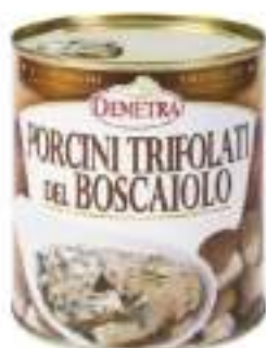
PORCINI TRIF.CAMPESINO L.4/4