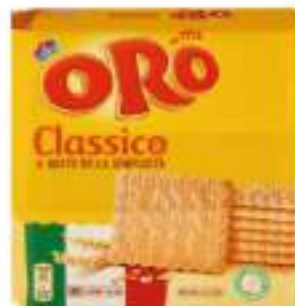
BISCOTTI ORO SAIWA