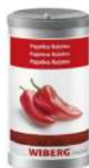
PAPRIKA RUBINO DELICATA