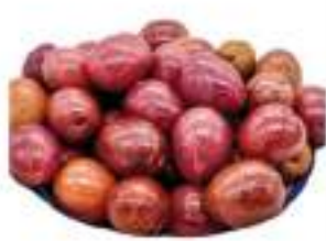
OLIVE NERE GRECIA GIGANTI K.5