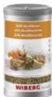
GRILL MEDITERRANEO WIBERG