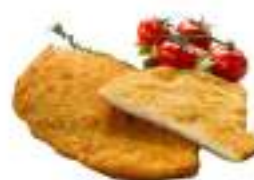
COTOLETTE POLLO AL FORNO 1,3 VASC.