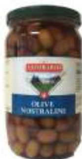
OLIVE MISTE TRIFOLATE 3100ML