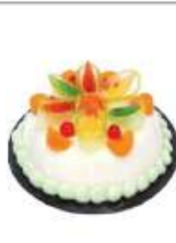
TORTA CASSATA SICILIANA 500G