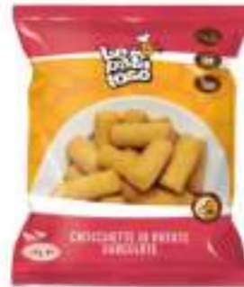
CROCCHETTE PATATE MC/CAIN