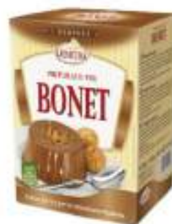
PREPARATO PER BONET