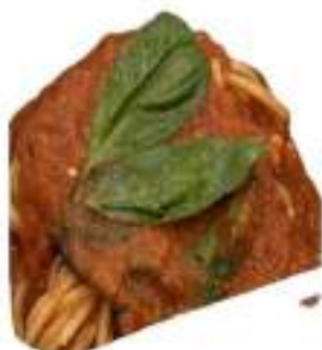
INVOLTINI SPAG/MELANZANE 2 KG VASC.