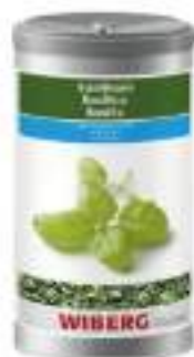
BASILICO LIOFILIZZATO WIBERG