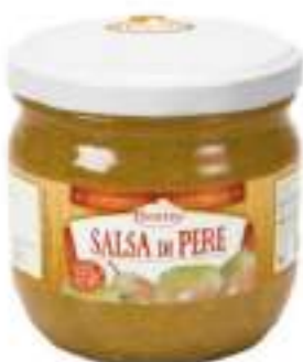
SALSA DI PERE VST 370 ML