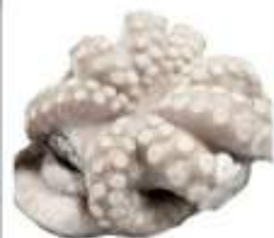
MOSCARDINI IQF BUSTA CONG.