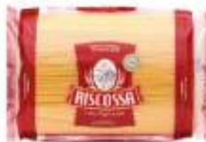
VERMICELLI RISCOSSA KG 3