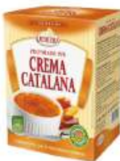
PREP. CREMA CATALANA 10X200G