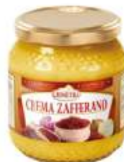
CREMA DI ZAFFERANO VASO 580ML