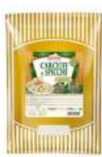
SPICCHI DI CARCIOFO NAT.bst1,5