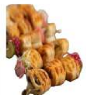
SALATINI MICRO BURRO 6 GUSTI G12 KG 5 CO