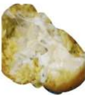
ARANCINI CACIO/PEPE 220G 30PZ CRUDI