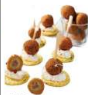
OLIVE RIPIENE AL TARTUFO G.20 KG 5 COTTE