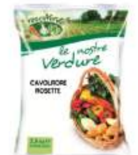
CAVOLFIORE CONG. 4X2,5