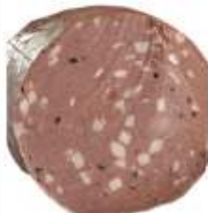
MORTADELLA CINGHIALE E TARTUFO