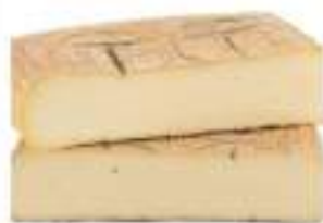
TALEGGIO FORME KG.2