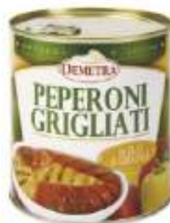
PEPERONI GRIGLIA O.G.4/4