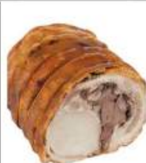
TRONCONE DI PORCHETTA