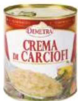
CREMA DI CARCIOFO LATT.4/4