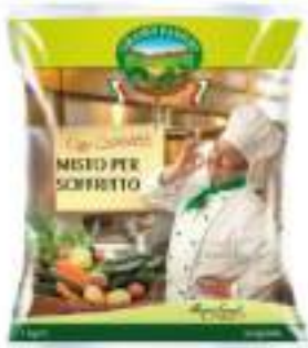
MISTO PER SOFFRITTO CONG.