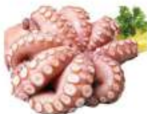
POLPO CILENO 1200/1500 PP