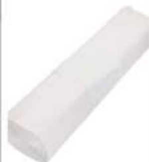
SACCHI BIANCHI 70X110