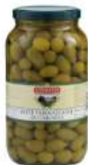
OLIVE VERDI GROSSE VASO KG3100