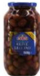
OLIVE LECCINO DEN VASO 1400