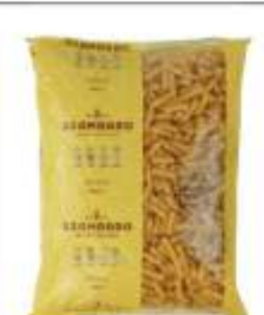
TORTIGLIONI SGAMBARO KG 5