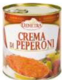
CREMA DI PEPERONI LATT.4/4