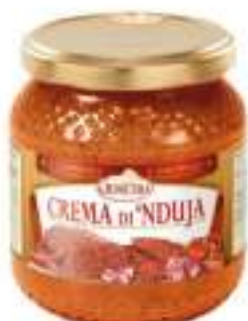
CREMA DI 'NDUJA VASO 580 ML