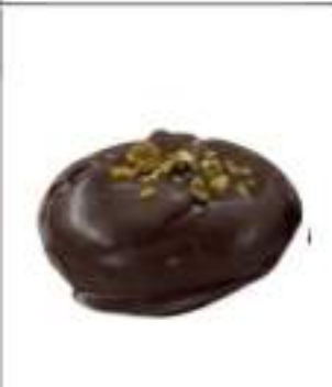
BERSAGLIERI KG 3