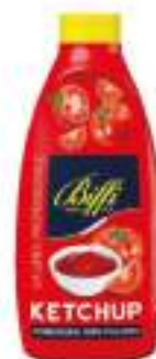
KETCHUP SQUEEZE CONF. 950 GR.