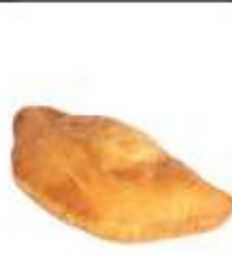
SICILIANE PISTACCHIO BACON 180G 20PZ COT