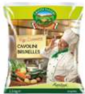
CAVOLINI BRUXELLES 4X2,5