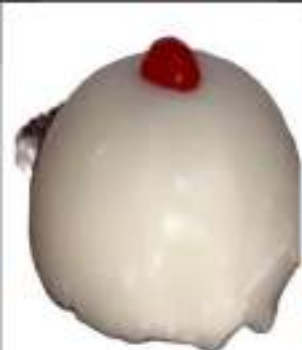
CASSATELLE RICOTTA GRANDI 180G 9 PZ