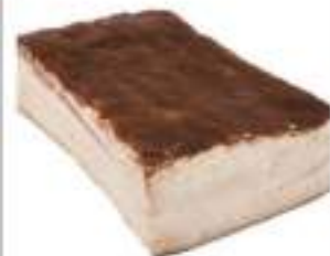
LARDO IN CONCA