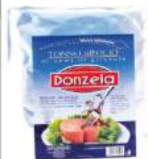
TONNO IN BUSTA KG 1 OLIO SEMI