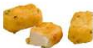
SFIZI MERLUZZO PASTELLATO G.12 KG 5