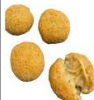
FRITTATINA CACIO PEPE G50 KG 5 COTTA