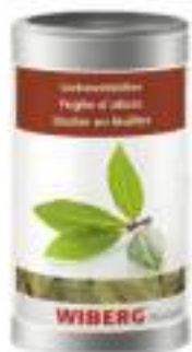
FOGLIE ALLORO BRT 1200