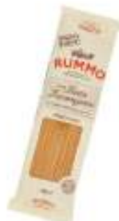
SPAGHETTI 3 RUMMO 500G