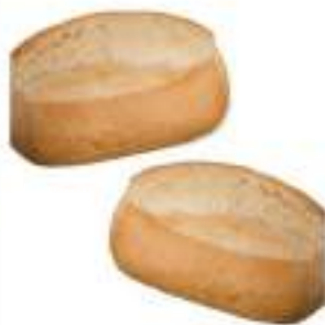
PANINO SENZA GLUTINE G. 70