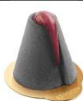
MONOPORZIONI VULCANO 100G 6PZ