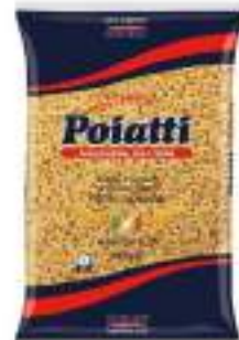
POIATTI ANELLINI 23 KG 1