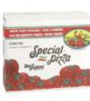
POLPA POMODORO BAGBOX KG 10