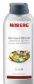
SALSA WOK TERIYAKI