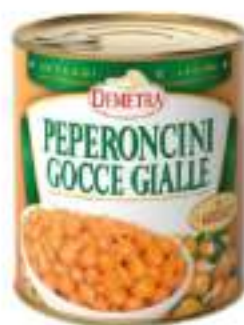
PEPERONCINI GOCCE GIALLE 4/4