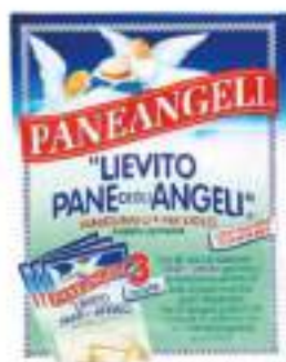
LIEVITO PER DOLCI SCATOLA