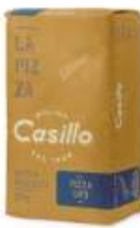
FARINA T 1 FORTE CON GERME