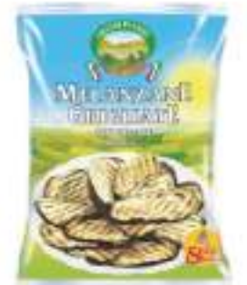
MELANZANE GRIG. CONG.