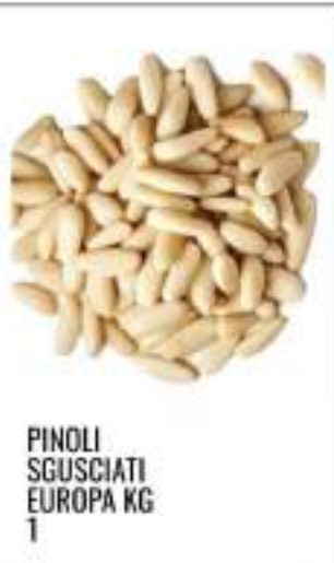
PINOLI SGUSCIATI EUROPA KG 1