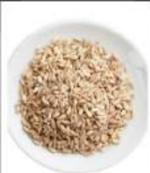
FARRO PERLATO TOSCANO G.500