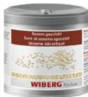
SEMI DI SESAMO SGUSCIATI