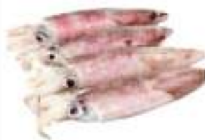
CALAMARI IQF THAI BUSTA 800G