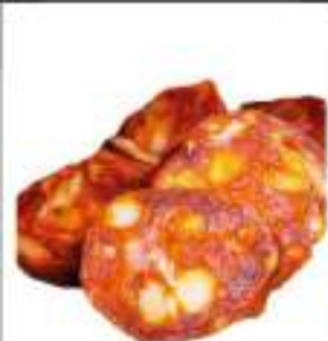
SALS. PICCANTE AFFETT. ATM