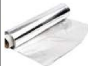
ALLUMINIO 150 MT