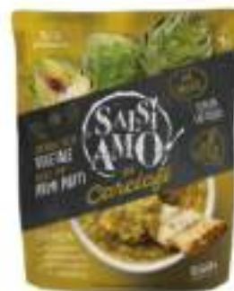
CREMOSITA' CARCIOFI CHEF 800BS