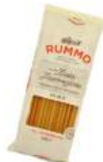
ZITE RUMMO G.500