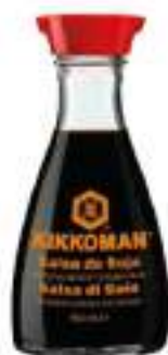
SALSA DI SOIA BOTTIGLIA