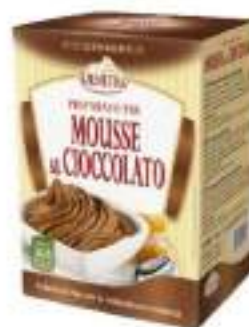
PREP MOUSSE CIOCCOLATO 7X440G