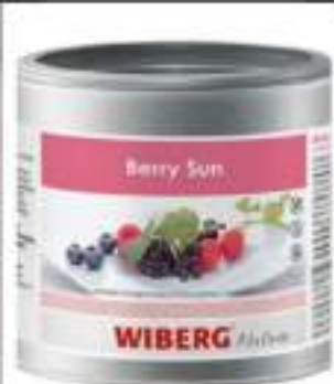
BERRY SUN PREP AROM.