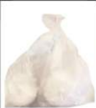
IMPASTO SURGELATO S/GLUTINE