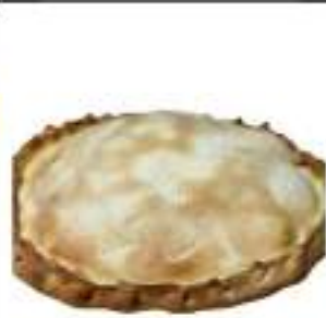
SCACCIATA PROSCIUTTO FORMAGGIO 1,5KG