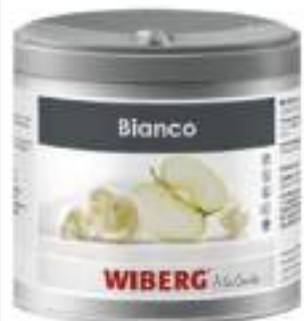
BIANCO PREP. STABILIZZATORE