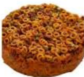
TIMBALLO ANELLETTI 2,5 KG