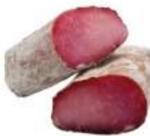
LOMBO SUINO STAGIONATO 1/2 SV