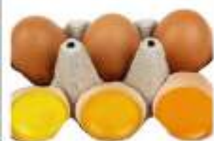
UOVA PASTA GIALLA