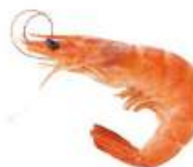
GAMBERI L1 ARG. AA 6X2 KG