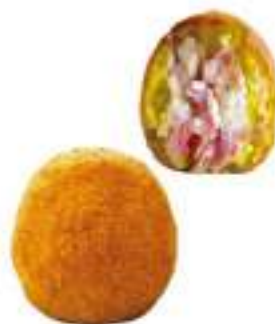
ARANCINI BURRO/PROSC.220G 30 PZ CRUDI