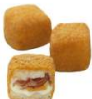
MOZZARELLA SPECK PROVOLA MIGNON G35 KG 4