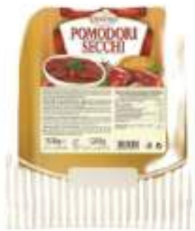
POMODORI ESSICCATI EXTRA SFUSI