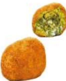
ARANCINI PISTACCHIO 220G 30PZ CRUDI