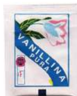
VANILLINA PURA G.0,5