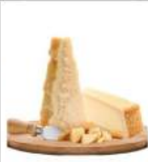
GRANA PADANO PORZIONI