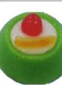
CASSATELLE RICOTTA VERDI 110G 12 PZ