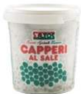
CAPPERI SALE KG 1 cal. 7/8