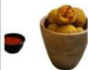
CROCCHETTE COUS COUS 25G KG 5 COTTE