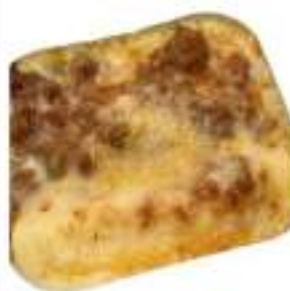
CANNELLONI PASTICCIATI KG 2,4