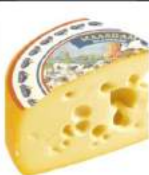
FORMAGGIO MAASDAM 1/4