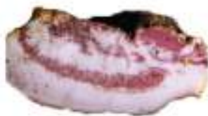
GOTA STAGIONATA SUINO SCARPACCIA