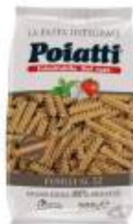
POIATTI FUSILLI INTEGRALI 52 G.500