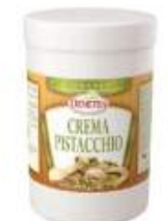
CREMA PISTACCHIO KG 1