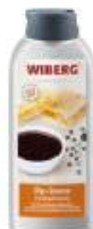
DIP SAUCE SMOKED HONEY WIBERG