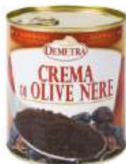
CREMA DI OLIVE LATTA 4/4