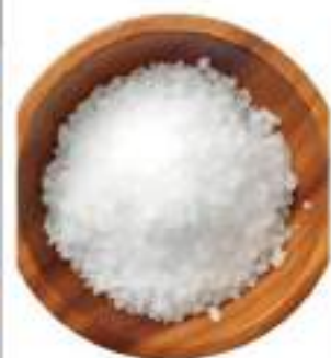
SALE SICILIA FINO SACCO KG 10