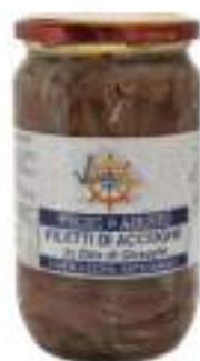
FILETTI DI ACCIUGHE VASO 720