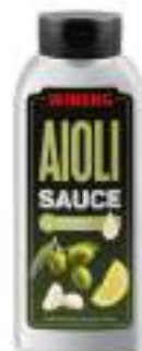
AIOLI' SAUCE WIBERG