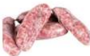
SALSICCIA MAZZI SCARPACCIA