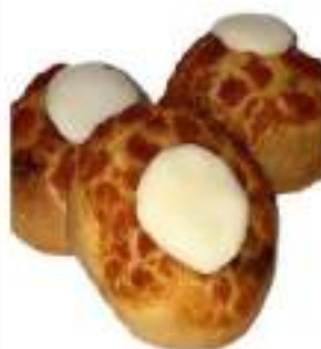
PIZZETTE MIGNON KG 3 COTTE