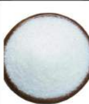
ZUCCHERO SEMOLATO KG.1