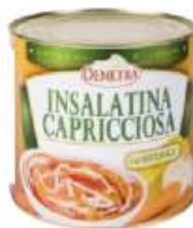
INSALATINA CAPRICCIOSA La 3/1