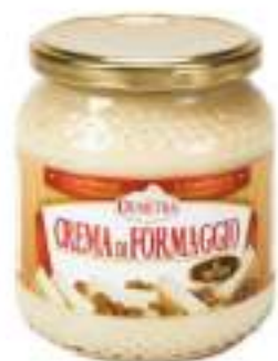
CREMA FORM.TARTUFO V. 500