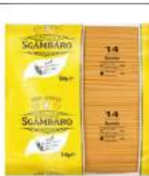
BAVETTE SGAMBARO KG 5