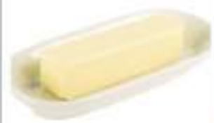
MARGARINA PANI DA 1 KG