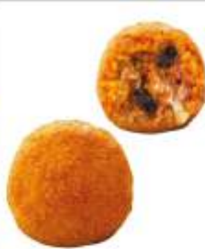
ARANCINA PREFRITTA ALLA NORMA GR.200X40