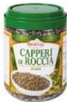
CAPPERI ROCCIA AL SALE KG 1