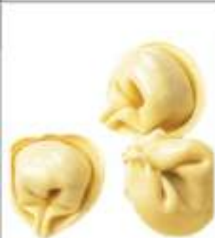
TORTELLINI CARNE KG 1 CONG.