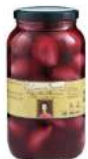
CIPOLLE ROSSE IN ACETO V.3100