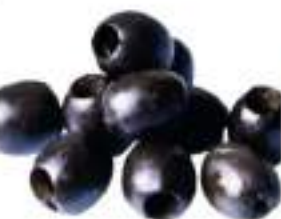
OLIVE NERE DEN. 28/32