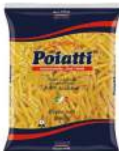
POIATTI PENNE 40 KG 1