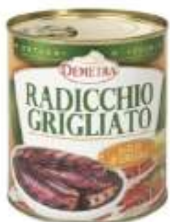
RADICCHIO GRIGLIATO 4/4