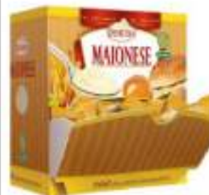
MAIONESE BUSTINE 12G DEMETRA