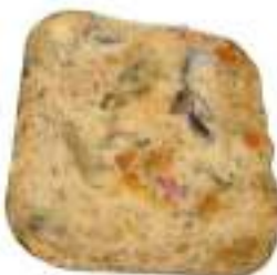
LASAGNE VEGETARIANE MONO 320G CA