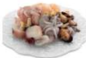
PREP. RISOTTO 3X1