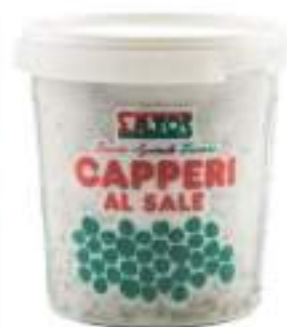
CAPPERI Kg1 cal.11/13