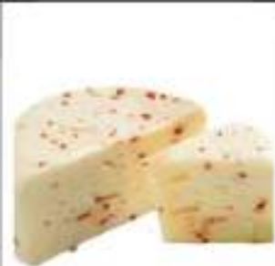
CACIOTTA AL PEPERONCINO