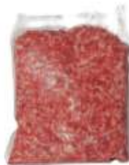
PASTA SALSICCIA CONF.KG.1 SV