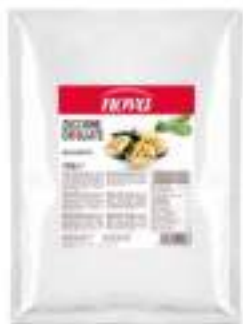
PRONTO PORCINO TRIF. BUSTA 800