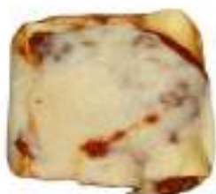
CANNELLONI PASTICCIATI MONO G.320 CA