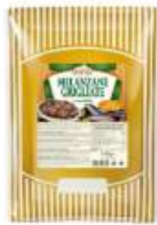
MELANZANE GRIG. RONDELLE B1700