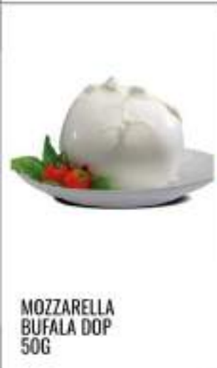
MOZZARELLA BUFALA DOP 50G