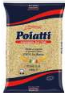
POIATTI PASTA PINOLI 18 KG 1