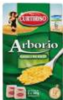
RISO SUPERFINO ARBORIO KG 1X5