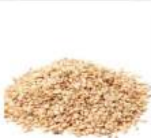
SESAMO NATURALE CONF.KG.1