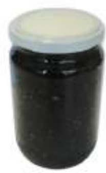
UOVA DI LONPO NERE VASO GR.350