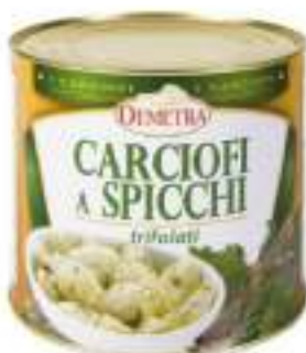
CARCIOFI SPICCHI TRIF. DEMETRA