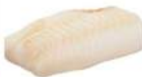
FIL. MERLUZZO NORDICO ISL.