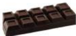
CIOCCOLATO FONDENTE KG 1