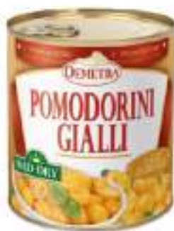
POMODORINI GIALLI MID DRY 4/4