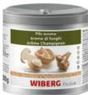
AROMA FUNGHI MACINATO WIBERG