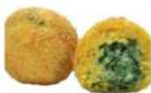
ARANCINETTI SPINACI MIGNON 5 KG CRUDI