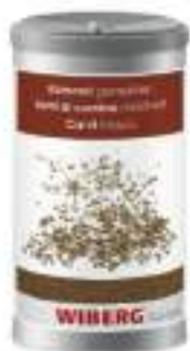
SEMI CUMINO WIBERG