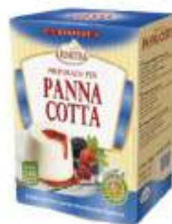
PREP PER PANNA COTTA 20 BUSTE