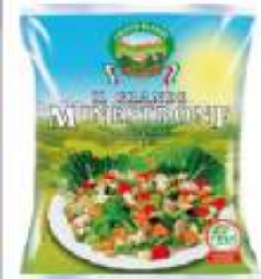
MINISTRONE CONG. 2,5 KG