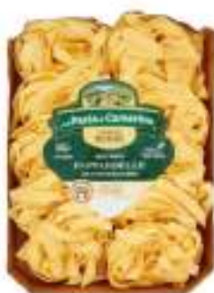
PAPPARDELLE UOVO G. 500