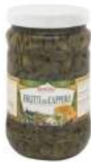
I FRUTTI DEL CAPPERO VASO 1700