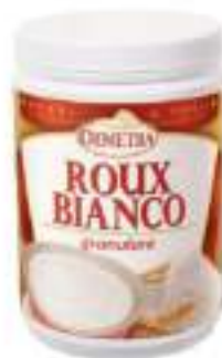
PREP. ROUX BIANCO 500G