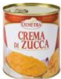
CREMA DI ZUCCA LATTA 4/4