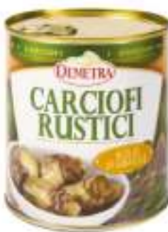
CARCIOFI RUSTICI LATTA 3/1