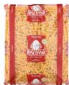
SPIRALI RISCOSSA KG 3