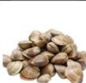
VONGOLE C/GUSCIO CONG.