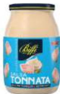
SALSA TONNATA VASCHETTA KG 1