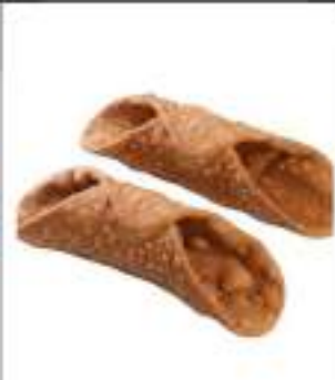
CANNOLI GRANDI 100 PZ