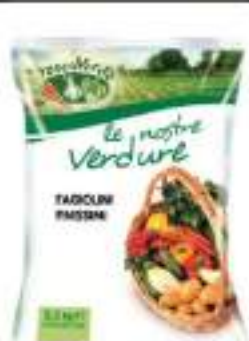
FAGIOLINI FINISSIM BUSTA 4X2,5