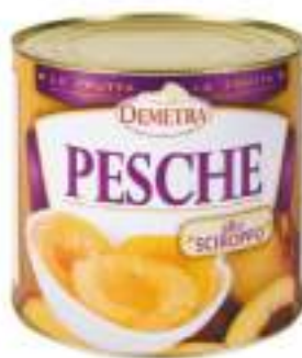
PESCHE SCIROPATE LATTA 3/1