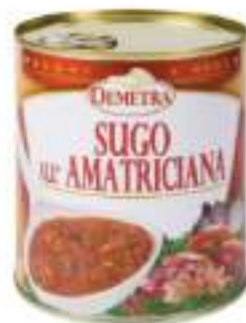
SUGO ALL'AMATRICIANA LATTA 4/4