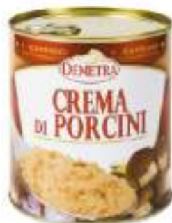
CREMA DI FUNGI PORCINI 4/4