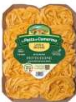
FETTUCCINE UOVO CAMERINO 500