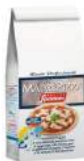
MADRE PIZZA KG 1