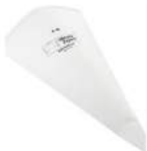
SACCO A POCHE 30X46 100 PZ