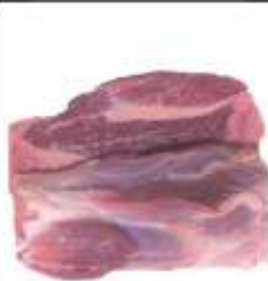
STINCO DI SUINO 1/2 CONG.