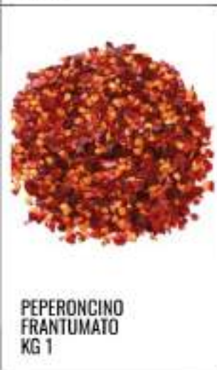
PEPERONCINO FRANTUMATO KG 1