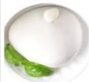
MOZZARELLA DI BUFALA 500 AVERSANA