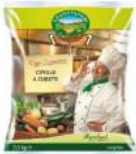
CIPOLLE TAGLIATE GELO