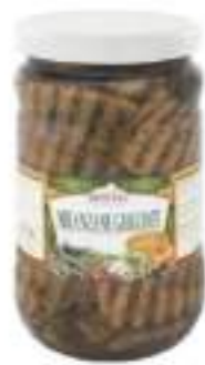
MELANZANE GRIGLiate VASO 1700