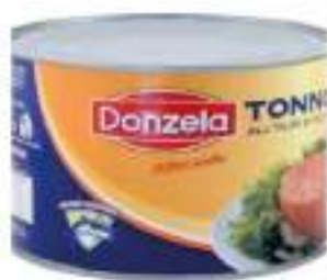
TONNO OLIO VEG. 1730