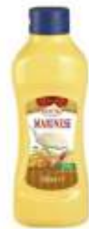
MAIONESE SQUEEZE 1 L DEM.