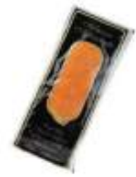
SALMONE AFFETT.BUSTE GR.200