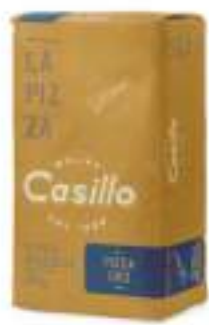
FARINA SEMOLA RIMAC. ORO KG 25