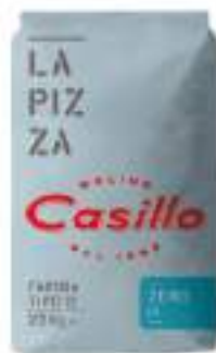
FARINA PER PIZZA O M KG 25