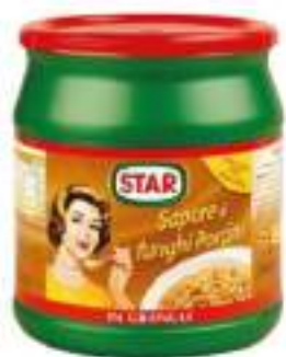
PREP. BRODO FUNGHI 500