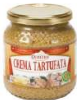
CREMA TARTUFATA VASO 500g