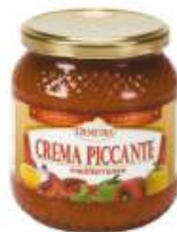
CREMA PICCANTE VASO 500G