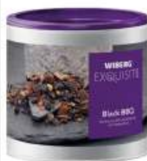
BLACK BBQ SALE AROMATICO WIBER