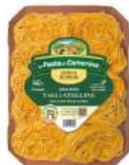
TAGLIATELLINE G. 500 UOVO