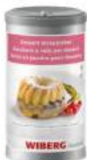
ZUCCHERO A VELO PER DESSERT WIBERG