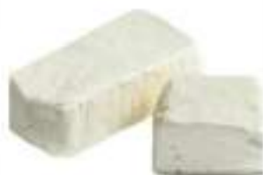
STRACCHINO PANETTO KG 1