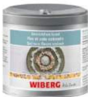
FIOR DI SALE COLORATO E SPEZIE