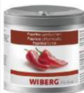
PAPRIKA AFFUMICATA WIBERG