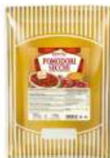
POMODORI SECCHI FILETTI B.1500