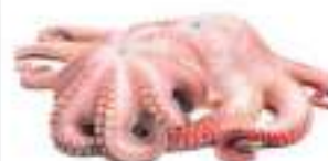
POLPO MAROCCO T7 CONG. KG 12