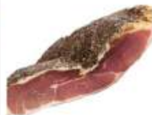
SGAMBATO 1/2 SV BIANCO