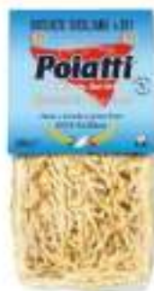
POIATTI BUSIATE SICILIANE 101 G.500