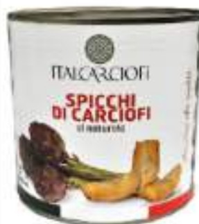
SPICCHI CARCIOFO NAT. 3/1