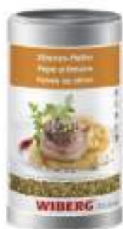
PEPE AL LIMONE WIBERG