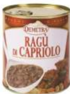
RAGÙ DI CAPRIOLO LATT.4/4