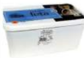
FETA GRECA VASCHETTA KG 2