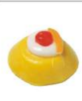
CASSATELLE MIGNON LIMONE 12 PZ 120G