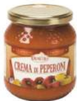
CREMA DI PEPERONI VASO G 500