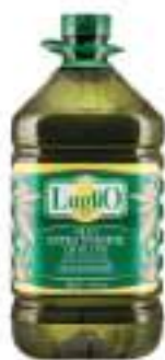
OLIO EXTRAVERGINE PET L 5