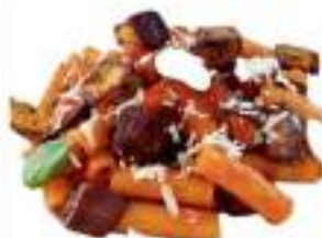
PASTA ALLA NORMA 300G CA MONO