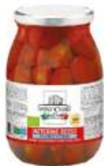
POMODORINO ROSSO NAT. VASO KG 1