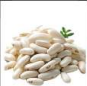
FAGIOLI GREAT NORTH.SECCHI KG5