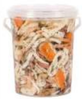
INSALATA MARE SECCHIO KG 1,6 sgocc.