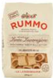
CALAMARATA RUMMO G.500