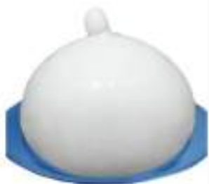
LA ZIZZONA DI BATTIPAGLIA