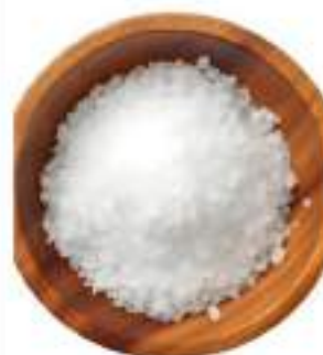
SALE FINE SICILIA CONF.KG.1