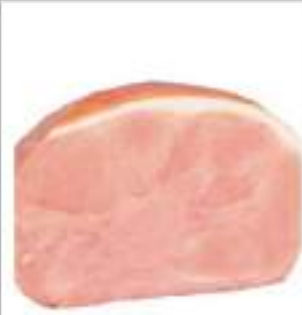
PROSC. COTTO SCELTO VERDE 1/2