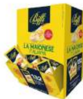
MAIONESE BUSTINE G. 12