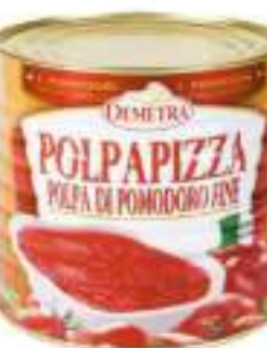
POLPA PIZZA DEMETRA 3/1