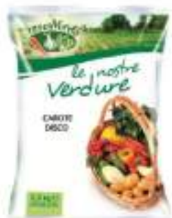
CAROTE DISCO BUSTA 4X2,5