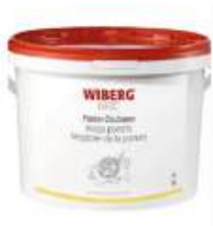
MAGO PANATA PANATURA SEC. 2 KG