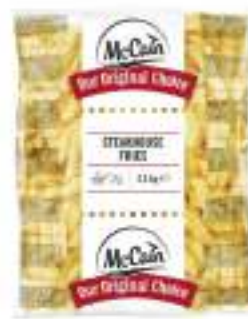
PATATE STEAKHOUSE MC