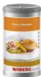
CURRY POWDER MISCELA SPEZIE