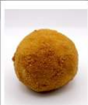
ARANCINA RAGU GR.200X40