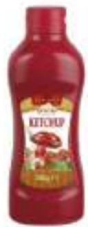
KETCHUP 1 L SQUEEZE