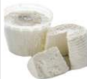
RICOTTA FRESCA PAST.