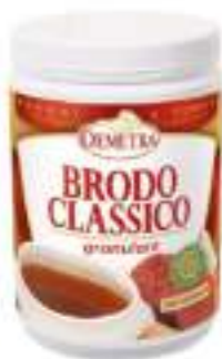
PREP. BRODO CLASSICO DEMETRA