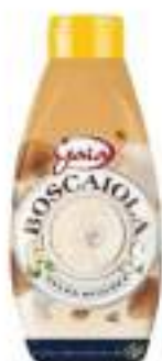
SALSA BOSCAIOLA SQUEEZE 820 ML