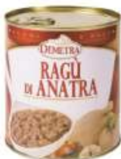
RAGÙ DI ANATRA LATT.4/4