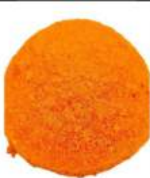
MONOPORZIONI ARANCELLO 135G 12 PZ