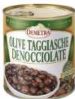
OLIVE TAGGIASCHE DEN 4/4 O.EX