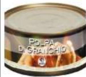
POLPA GRANCHIO THAIL. G. 170