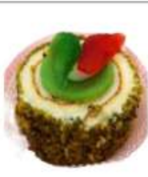
MONOPORZIONE A VELI PISTACCHIO 135G