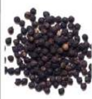
PEPE NERO IN GRANI SACC.KG.1