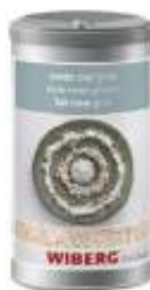
SALE ROSA GROSSO NON IODATO 1400