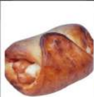
CARTOCciate WURSTEL 165G 25PZ