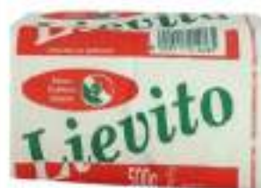
LIEVITO PER PANIFICAZIONE