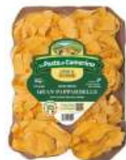
GRAN PAPPARDELLA CAMERINO 500G