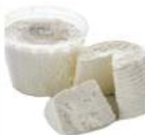
RICOTTA TOSCANA P.P.LA PECORA