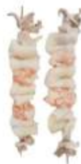
SPIEDINI CALAMARI GAMBERI CONG