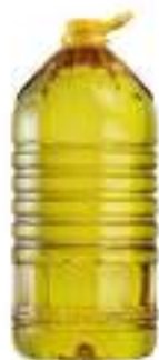
OLIO SEMI DI GIRASOLE L 10 PET