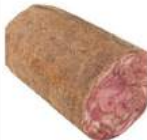
SOPRASSATA S/V C.3/4 K