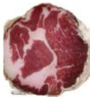
CAPOCOLLO STAG. SUINO SCARPACCIA