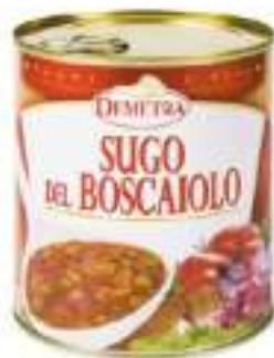
SUGO ALLA BOSCAIOLA LATT.4/4