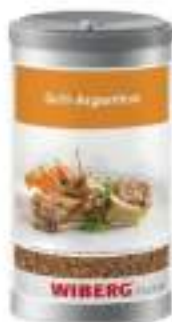
GRILL BARBECUE SALE AROMATICO