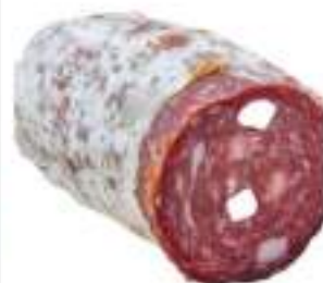
SALAME TOSCANO 1/2