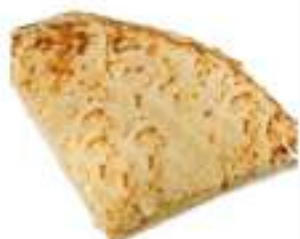
PANE CARASAU SPICCHIO