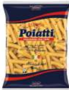
POIATTI ELICOIDALI 63 KG 1