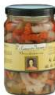
GIARDINIERA ACETO VASO 3100 ML