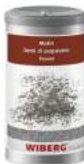
SEMI PAPAVERO INTERI WIBERG