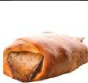
CARTOCCIATE MELANZANE 165G 25 PZ