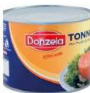
TONNO OLIO OLIVA DONZELA 1.7