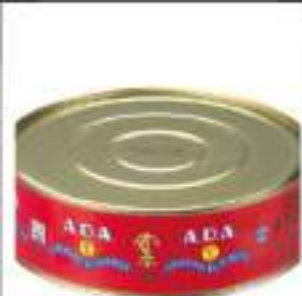
TONNO FILETTI LATTA 1,850