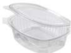
CONTENITORI ASPORTO L 1X40