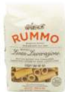
RIGATONI 50 RUMMO 0,500 G