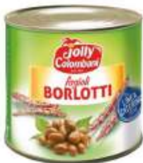
FAGIOLI BORLOTTI JOLLI TRK 380