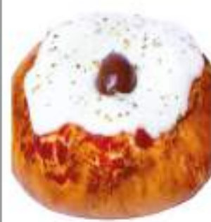
PIZZETTE 160G 20 PZ COTTE