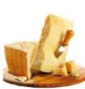
PARMIGIANO REGGIANO SCELTO