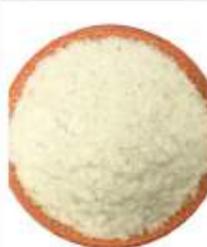
FIOCCHI DI PATATE CONF.KG.1