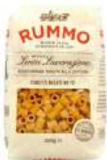
TUBETTI RIGATI 72 RUMMO KG 1