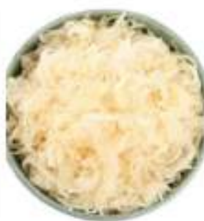
CRAUTI AL NATURALE 500g