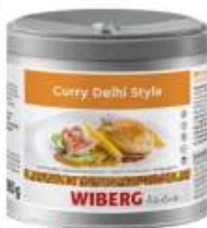
CURRY DELHI WIBERG