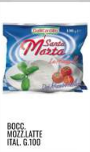
BOCC. MOZZ. LATTE ITAL. G.100