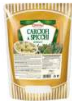
CARCIOFI SPICCHI TRIF. BST 700