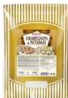
FUNGHI CHAMPIGNON NAT.1,7 ML