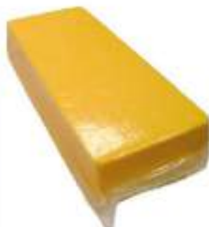
CHEDDAR 50% 2,5 KG