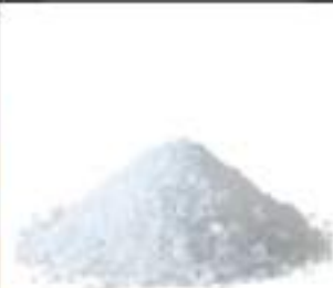
SALE GROSSO SICILIA CONF.KG.1