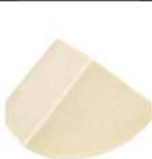
PECORINO ROMANO S/V 1/8 KG 3