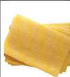
PASTA SFOGLIA LASAGNE SURG.