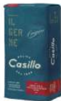
FARINA TIPO 2 MEDIA ORIGINE