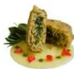
FRITTATINA SALSICCIA FRIARELLI G65 KG 5