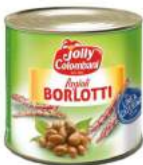
FAGIOLI BORLOTTI LATTA 3/1