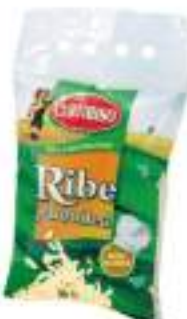
RISO RIBE PARBOILED KG 5