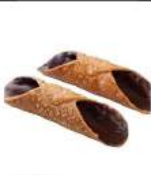
CANNOLI GRANDI GLASS. CACAO X 100PZ