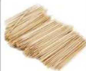
STUZZICADENTI 500 PZ