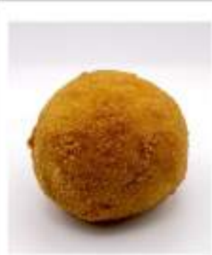
ARANCINA PREFRITTA RAGU GR.200X40