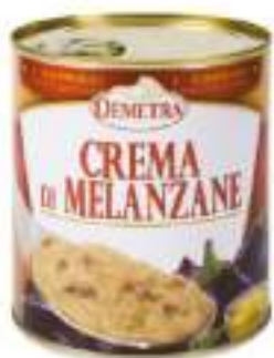
CREMA DI MELANZANE L.4/4