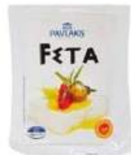
FETA GRECA MONO G.200