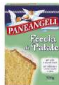
FECOLA DI PATATE G.500