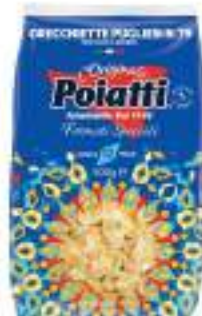
POIATTI ORECCHIETTE PUGLIESI 79 G.500