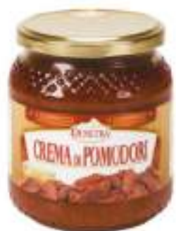
CREMA DI POMODORO ESS.V.500