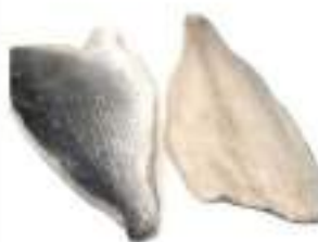
ORATA FILETTI 120/160