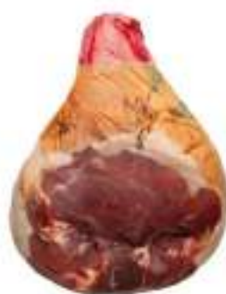
PROSC.CRUDO PARMA S/O