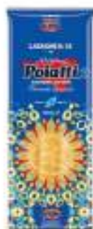
POIATTI LASAGNE 15 G.500