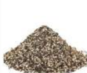
PEPE NERO SPEZZATO KG 1