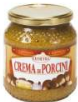
CREMA DI PORCINI VASO 500G