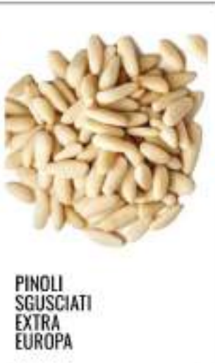
PINOLI SGUSCIATI EXTRA EUROPA