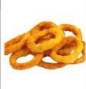
CIPOLLA ANELLI PASTELLATI CONG