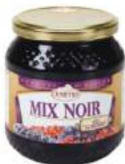
MAGIA BOSCO MIX NOIR VASO 500