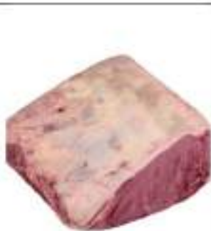
ROASTBEEF B.A. FEMM. C/O POL.