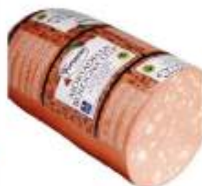
MORTADELLA BOLOGNA FIORUCCI