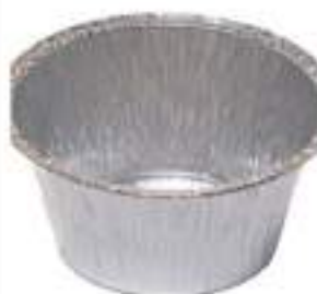
CONT.MONOP. CONF. PZ 100