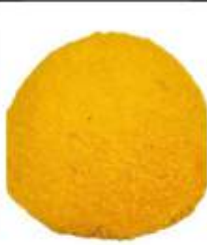
MONOPORZIONI LIMONELLO 135G 12PZ