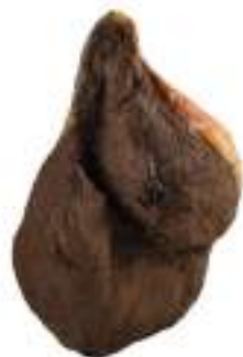
COSCIA SGAMB. SCARPACCIA