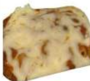
PASTA AL FORNO 2,7 KG