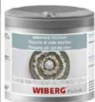
FIOCCHI DI SALE MARINO WIBERG