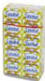
LIEVITO MIGNON G. 25X20pz