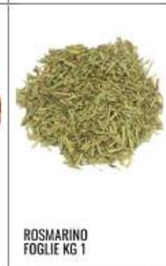
ROSMARINO FOGLIE KG 1