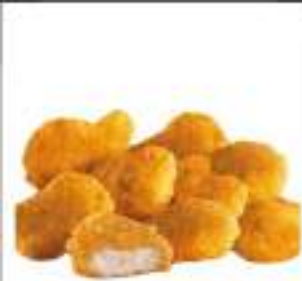
BOCCONCINI DI POLLO CONG.