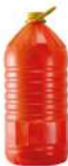
OLIO PALMA BIFRAZIONATO L 10