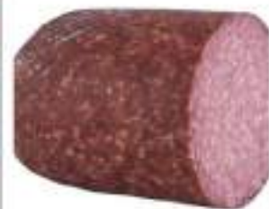
SALAME TOSC. KG 5 NORCIN.