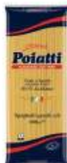
POIATTI SPAGHETTI QUADRI 8 KG 1