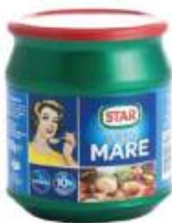
PREP. BRODO MARE STAR 500 G