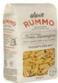
GNOCCHETTI SARDI 63 RUMMO G.500