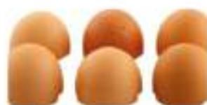
UOVA FRESCHE CONF.X6