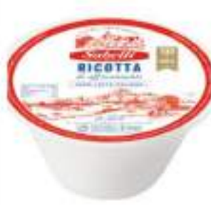
RICOTTA SABELLI CREMOSA