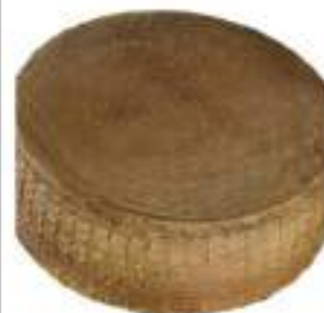
ORO DI MAREMMA PECORINO STAG. GROTTA