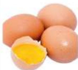
UOVA FRESCHE CATA GR.53/62 M