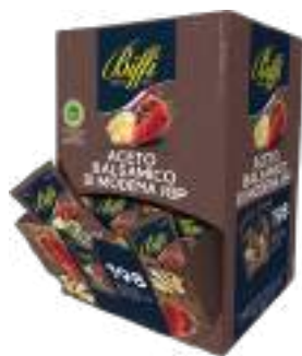
ACETO BALS. MODENA BST 5 M