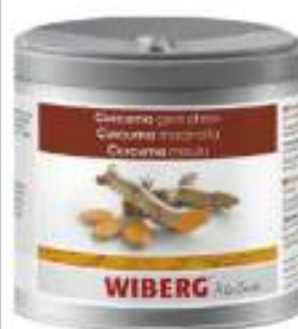
CURCUMA MACINATA WIBERG