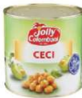
CECI JOLLI LATTA 3/1