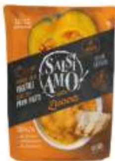
CREMOSITA'ZUCCA CHEF 800G BST