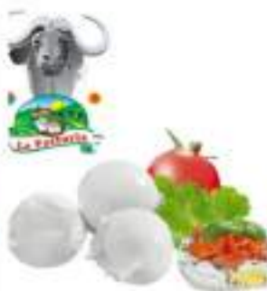
MOZZARELLA BUFALA 125 FATTORIA