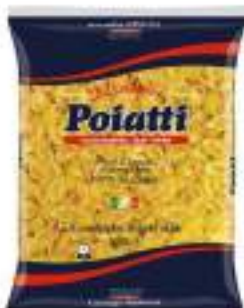
POIATTI CONCHIGLIE RIGATE 36 KG 1