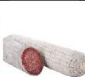
SALAME MILANO KG.2/3