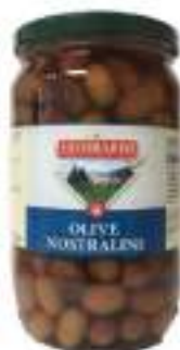
OLIVE MISTE TRIF. VASO 1,062