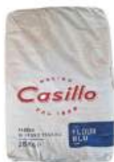
FARINA CASILLO flour blu 00 25