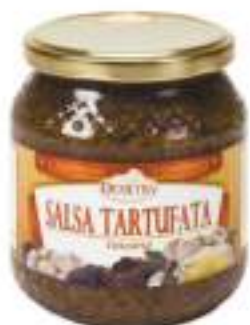
SALSA TARTUFATA TOSCANA G.500