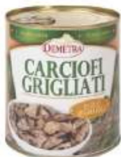
CARCIOFI GRIGLIA O.G.4/4