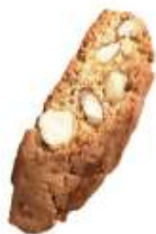
CANTUCCI CON MANDORLE