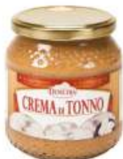
CREMA DI TONNO VASO 580