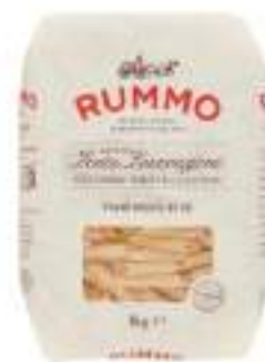
PENNE RIGATE 66 RUMMO KG 1