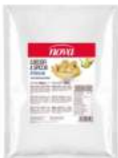
SPICCHI CARCIOFO NAT BUST 1700 NOVA