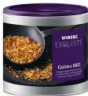
GOLDEN BBQ MISCELA AROMATIZZATA WIBERG