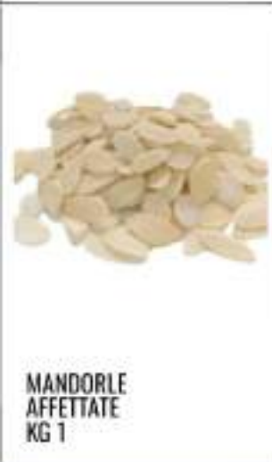
MANDORLE AFFETTATE KG 1