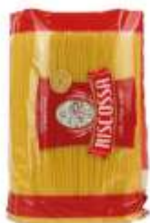
SPAGHETTI RISC. KG 3