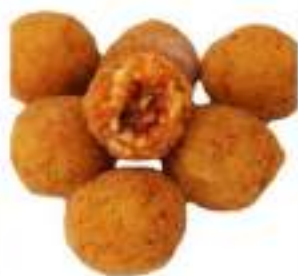
ARANCINETTI RAGÙ MIGNON CRUDI CT