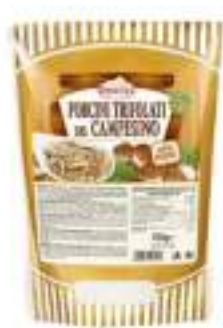
PORCINI CAMPESINO BST 700G