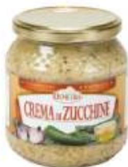
CREMA DI ZUCCHINE VETRO 500