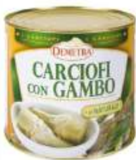
CARCIOFI C/GAMBO NAT.3/1