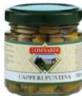
CAPPERI PUNT.VASO 720 ML