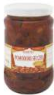
POMODORI SECCHI O.G. VASO 1700