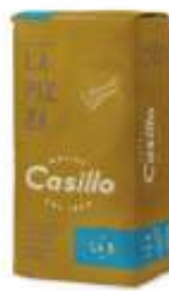
LA 8 CON GERME DI GRANO 12,5KG