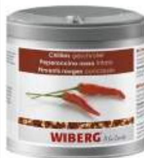
PEPERONCINO ROSSO TRITATO