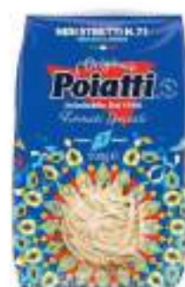
POIATTI NIDI STR. 71 G.500