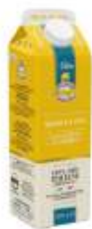
UOVO MIX BRIK 1 L