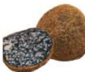
ARANCINI NERO DI SEPPIA 220G 30 PZ CRUDI