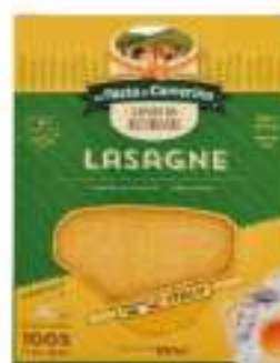
LASAGNE UOVO 500 G.