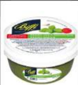
PESTO GENOVESE BIFFI 1,5