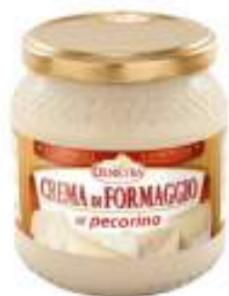
CREMA DI PECORINO G. 500 VASO