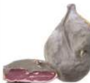
SGAMBATO BIANCO TIPO SPECK