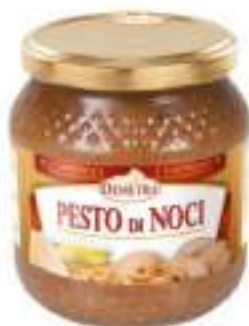
PESTO DI NOCI VASO 500G