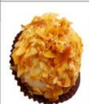
MONOPORZIONE FEDORA 135G