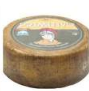
PECORINO PRIMITIVO STAGIONATO