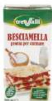
BESCIAMELLA ML 500