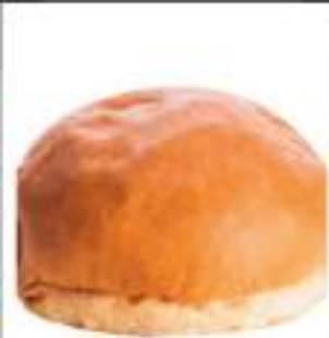
PANE PER HAMBURGER