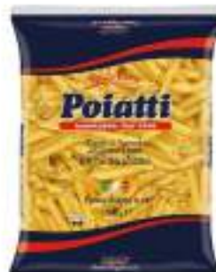
POIATTI PENNE RIGATE 41 KG 1