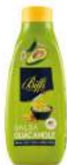
GUACAMOLE GAIA 800G TWISTER