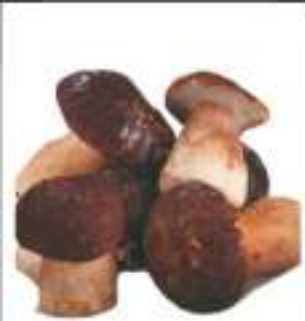
PORCINI CONG. INTERI