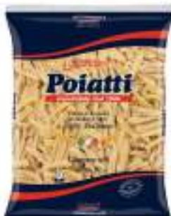
POIATTI CASERECCE 50 KG 1