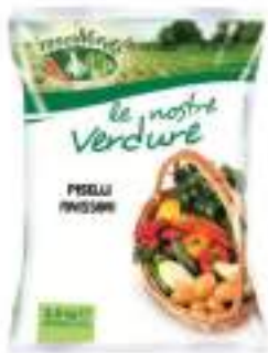
PISELLI FINISSIMI BUSTA 4X2,5