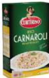
RISO CARNAROLI KG 1X5