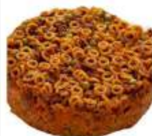
TIMBALLO ANELLETTI MONO 350G CA