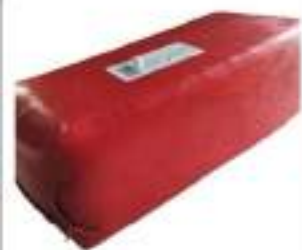
PREP. ALIM. ADAMINO KG 2,5