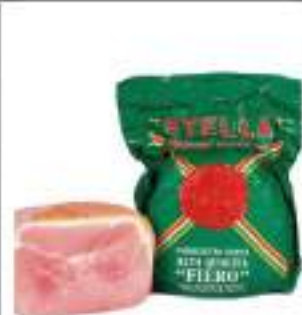
PROSCIUTTO COTTO FIERO 1/2